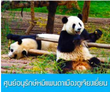
ศูนย์อนุรักษ์หมีแพนดามือวูริยวี่เยียน

พักที่ โรงแรม MINGZHI SHANGCHUN HOTEL ระดับ 4 ดาวท้องถิ่นหรือเทียบเท่าในเมืองตูเจียงเยียน