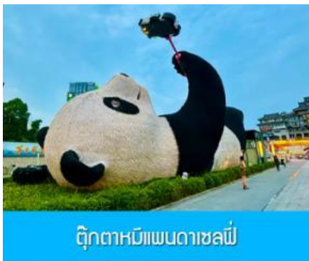
ตึกตาหมีแพนด้าเซลฟี

ไกด์ท้องถิ่นนำเสนอโปรแกรมทัวร์เสริมแพ็คเกจเที่ยวชมศูนย์อนุรักษ์หมีแพนด้า เป็นศูนย์อนุรักษ์แบบเลี้ยงปล่อยขนาดใหญ่บนเนื้อที่กว่าพันไร่ ท่านจะได้สัมผัสความน่ารักของหมีแพนด้าท่ามกลางธรรมชาติ..... อัตราค่าบริการสำหรับโปรแกรมเสริม ท่านละ 380 หยวนหรือ 1,900 บาท ใช้เวลา (รวมเวลาเดินทางไป กลับ) ประมาณ 3 - 4 ชั่วโมง ค่าบริการรวม ค่าบัตรเข้า ค่ารถบัสรับ และค่าน้ำทิยวของไกด์ท้องถิ่น