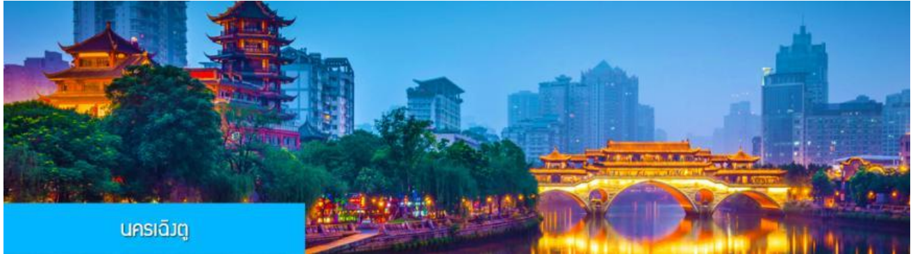
นครเฉิงตู