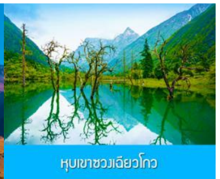
หุบเขาขวงเฉียวโกว