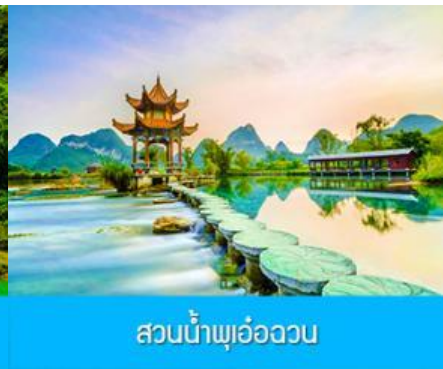
สวนน้ำพุเอ๋อววน