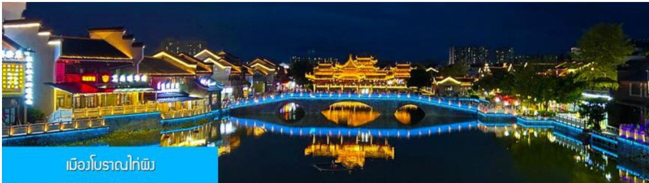
เมืองโบราณไถ่ผิง