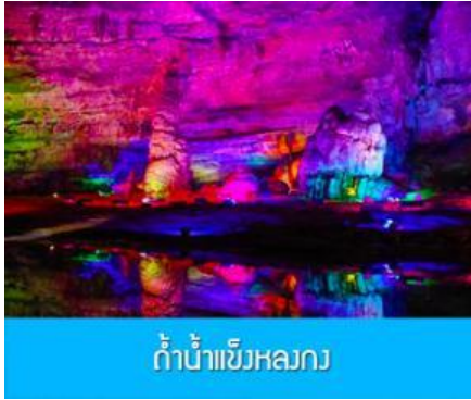
ถ้ำน้ำแข็งหลงกง