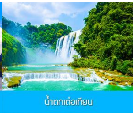
น้ำตกเต๋อเทียน