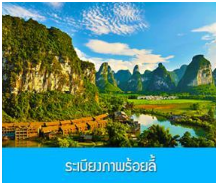
ระเบียงภาพร้อยลี้

พักที่ CHONGZUO YA STE HUAXI HOTEL โรงแรมระดับ 4 ดาวท้องถิ่น หรือเทียบเท่าในเมืองฉงจั่ว