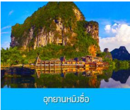
อุทยานหมิงชื้อ

พักที่ MINGSHI YISHU HOTEL ระดับ 3 ดาวท้องถิ่นหรือเทียบเท่าในอุทยานหมิงชื้อ