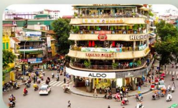
ถนน 36 สาย