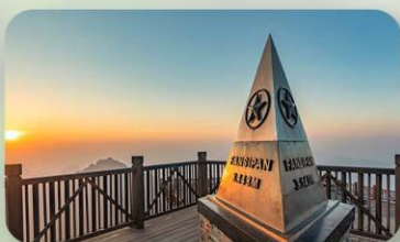
ฟานซีปัน