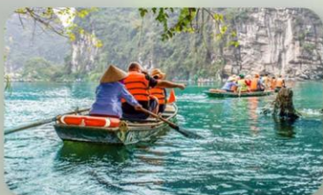
ล่องเรือตามก๊ก