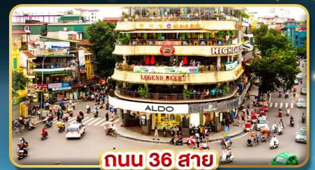
ถนน 36 สาย