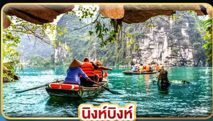
นิงห์บิงห์