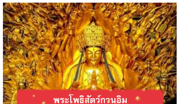
พระโพธิสัตว์กวนอิม

นำท่านเดินทางสู่ มรดกโลกอุทยานผาหินแกะสลักต้าจู๋ ศิลปะหินแกะสลักอันล้ำค่าแห่งเมืองฉงชิ่งมรดกโลกที่องค์การยูเนสโกขึ้นทะเบียนเมื่อปี ค.ศ. 1999 ตั้งอยู่ทางตะวันตกของนครฉงชิ่ง ประเทศจีน ศิลปะหินแกะสลักเหล่านี้สร้างขึ้นตั้งแต่ราชวงศ์ถังจนถึงราชวงศ์ซ่ง มีอายุมากกว่า 1,000 ปีโดดเด่นด้วยงานแกะสลักทางพุทธศาสนาที่งดงามและยังคงสภาพสมบูรณ์ (ใช้เวลาเดินทางประมาณ 1-2 ชั่วโมง)