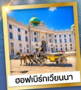
ฮอฟบวร์กเวียนนา