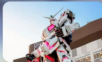
ช้อปปิงโอไดบะ