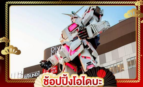
ช้อปปิ้งโอไดบะ