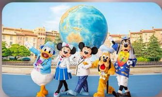
อิสระตามอัธยาศัย 2 วัน

HOTEL ASIA NARITA หรือเทียบเท่ามาตรฐานญี่ปุ่น