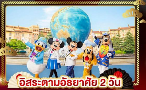
อิสระตามอริยาศัย 2 วัน