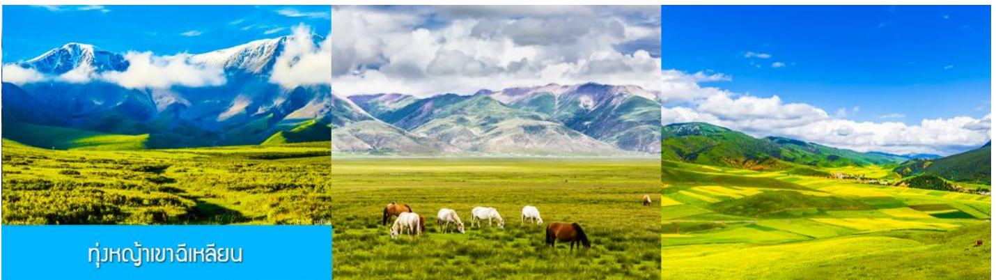
ทุ่งหญ้าฉีเหลียน

จากนั้นนำท่านเดินทางโดยรถบัสสู่ทุ่งหญ้าฉีเหลียน (ระยะทาง 140 กม. ใช้เวลาเดินทางประมาณ 2 ชั่วโมง)