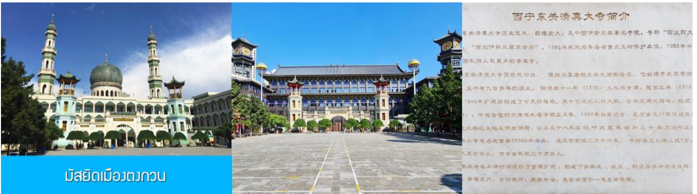
มัสยิดเมืองตงกวน

เช้า บริการอาหารเช้า ณ ร้านอาหารในโรงแรม (17)