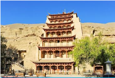
ถ้ำหินมั่วเกาคุ