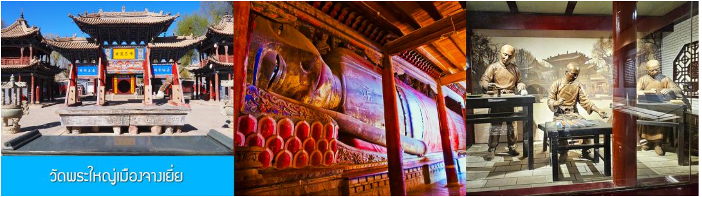
วัดพระใหญ่เมืองจางเยี่ย