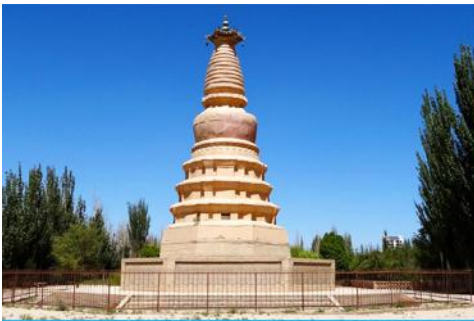
เจดีย์ม้าขาว