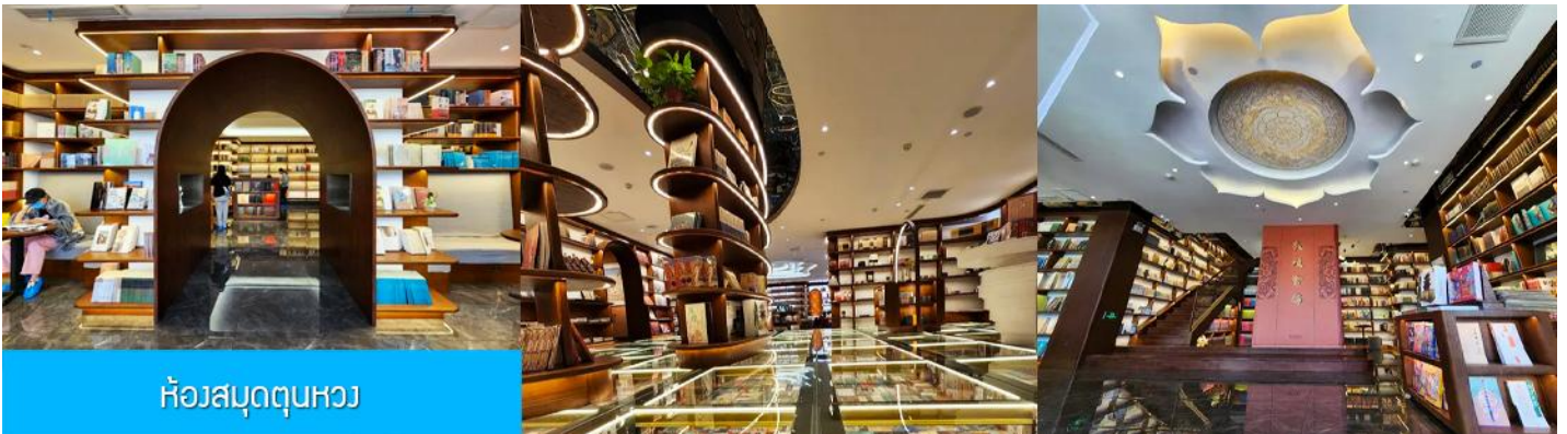
ห้องสมุดตุนหวง

(หมายเหตุ ค่าทัวร์รวมเฉพาะค่าผ่านประตูเข้าอุทยาน และรวมค่ารถแบตเตอรี่ไปยังสระน้ำวงพระจันทร์ ค่าทัวร์ไม่รวมค่ากิจกรรมค่ากิจกรรมอื่น ๆ อาทิ ค่าขี่อูฐ 130 หยวน นักท่องเที่ยวสูงวัยไม่แนะนำให้ขี่อูฐ ค่าขึ้นรถสกูตเตอร์ดูขุทะเลทราย (สอบถามราคาจากไกด์) และค่าถุงครอบรองเท้ากันทรายคู่ละ 20 หยวน)