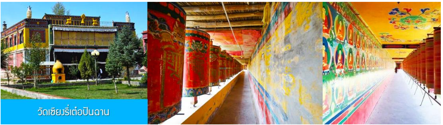
วัดเซียงรีเต๋อปิ่นฉาน