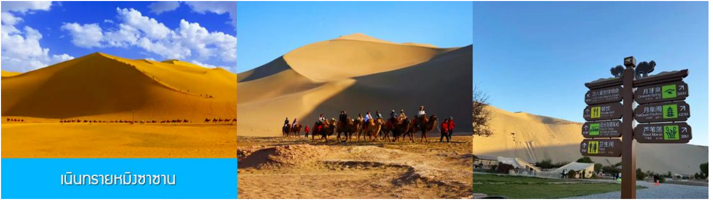
เนินทรายหมิงซาซาน