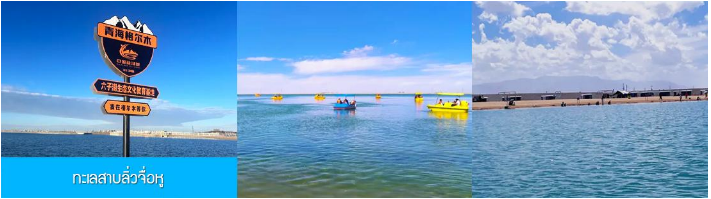
ทะเลสาบลิวจื่อหู