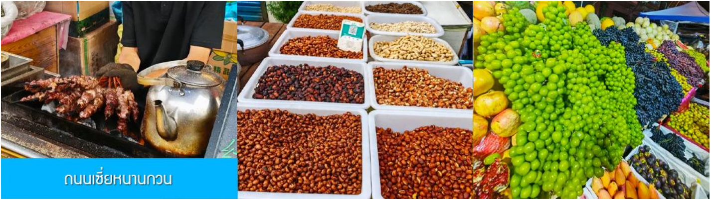
ถนนเซี่ยหนานกวน