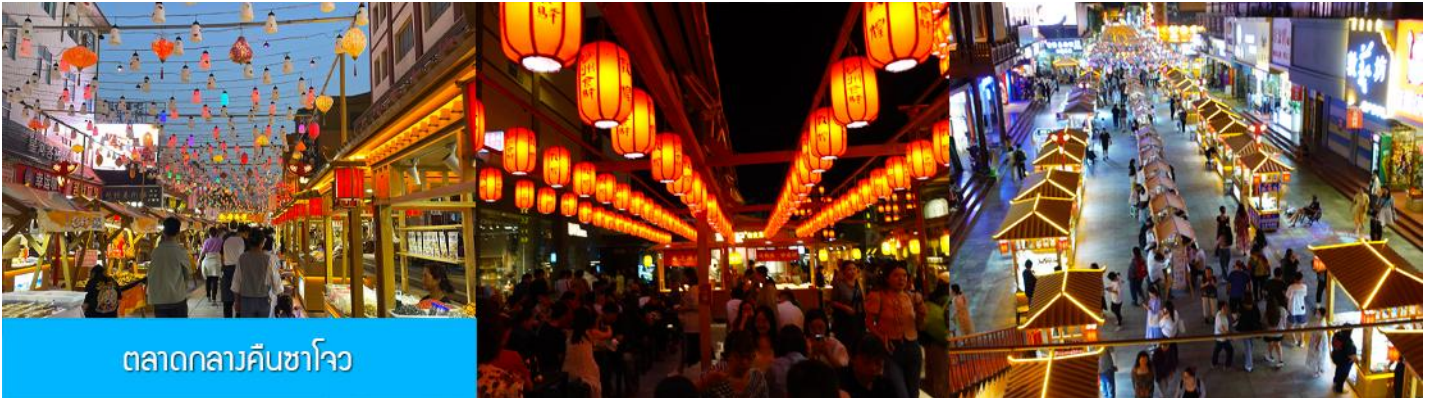
ตลาดกลางคืนซาโจว