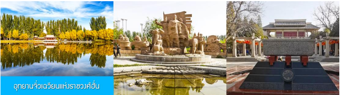
อุทยานจีวเฉวียนแห่งราชวงศ์ฮั่น

จากนั้นนำท่านเดินทางสู่เมืองจีวเฉวียน (ระยะทาง 50 กม. ใช้เวลาเดินทาง 1 ชั่วโมง)