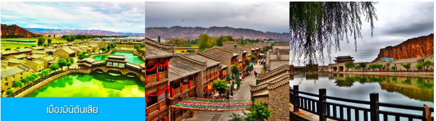
เมืองมินิดินสี