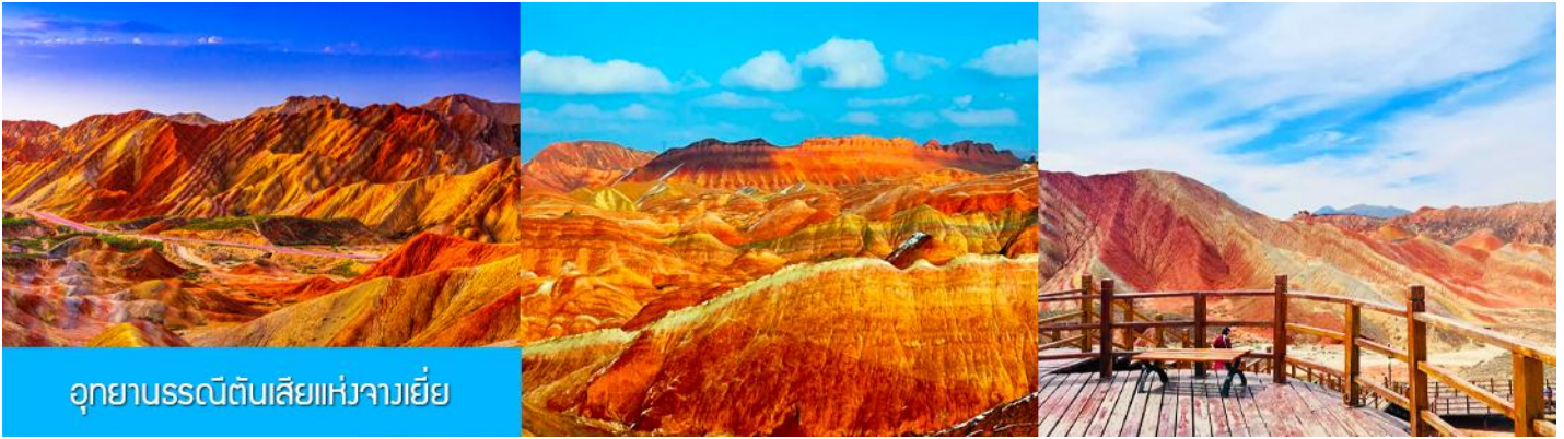
อุทยานธรณีดินสีแห่งจางเยี่ย