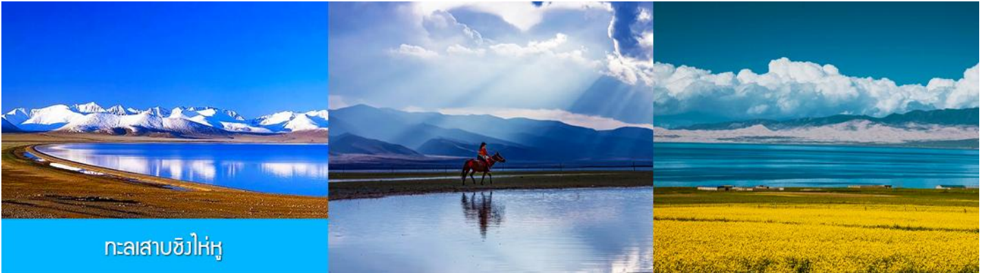
ทะเลสาบชิงไห่หู

นำท่านเดินทางสู่ ทะเลสาบชิงไห่หู (ระยะทาง 150 กม.ใช้เวลาเดินทางราว 2 ชั่วโมงเศษ)