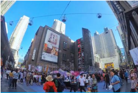
ย่านการค้าและถนนคนเดินลีเหมิง