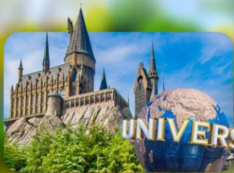
เลือกอิสระ Universal Studios Japan