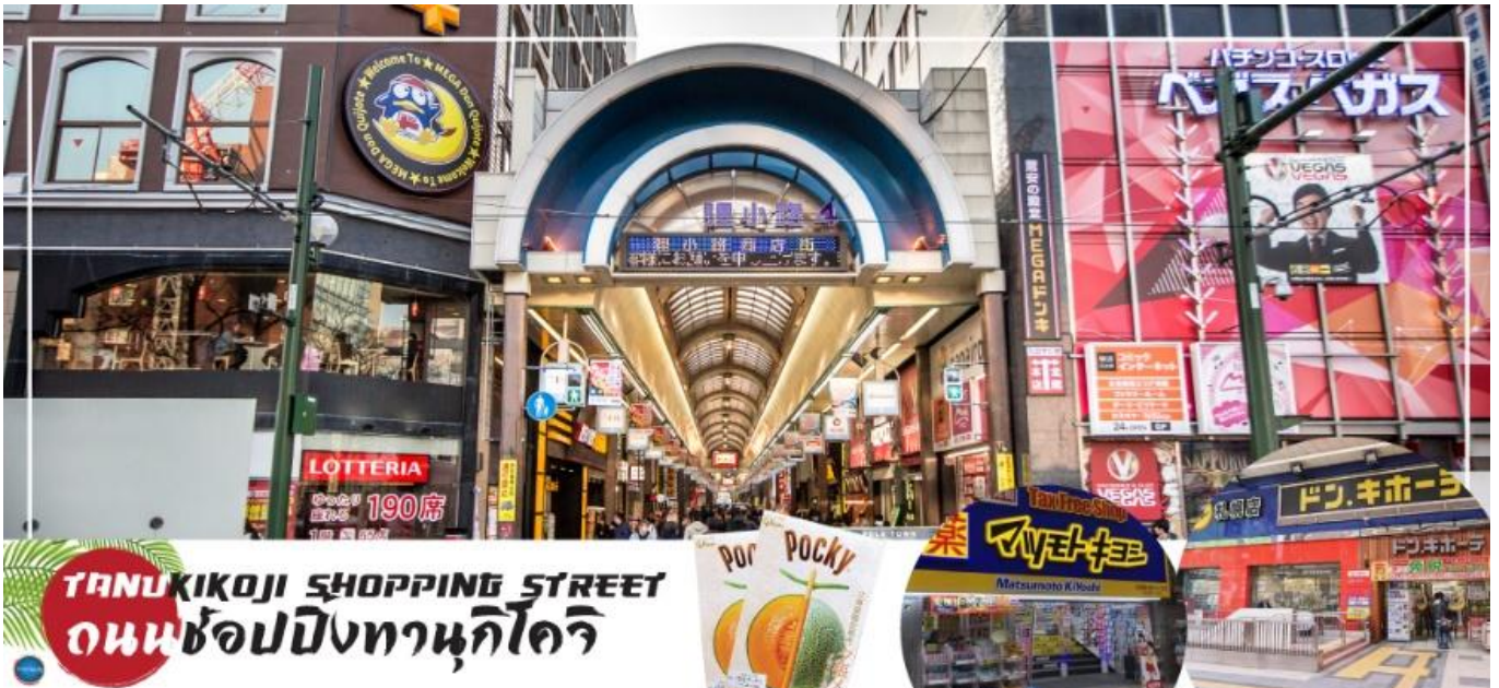
TANUKIKOJI SHOPPING STREET ถนนช้อปปิ้งทานุกิโคจิ

ที่พัก SMILE HOTEL PREMIUM - SAPPORO SUSUKINO หรือเทียบเท่าระดับเดียวกัน