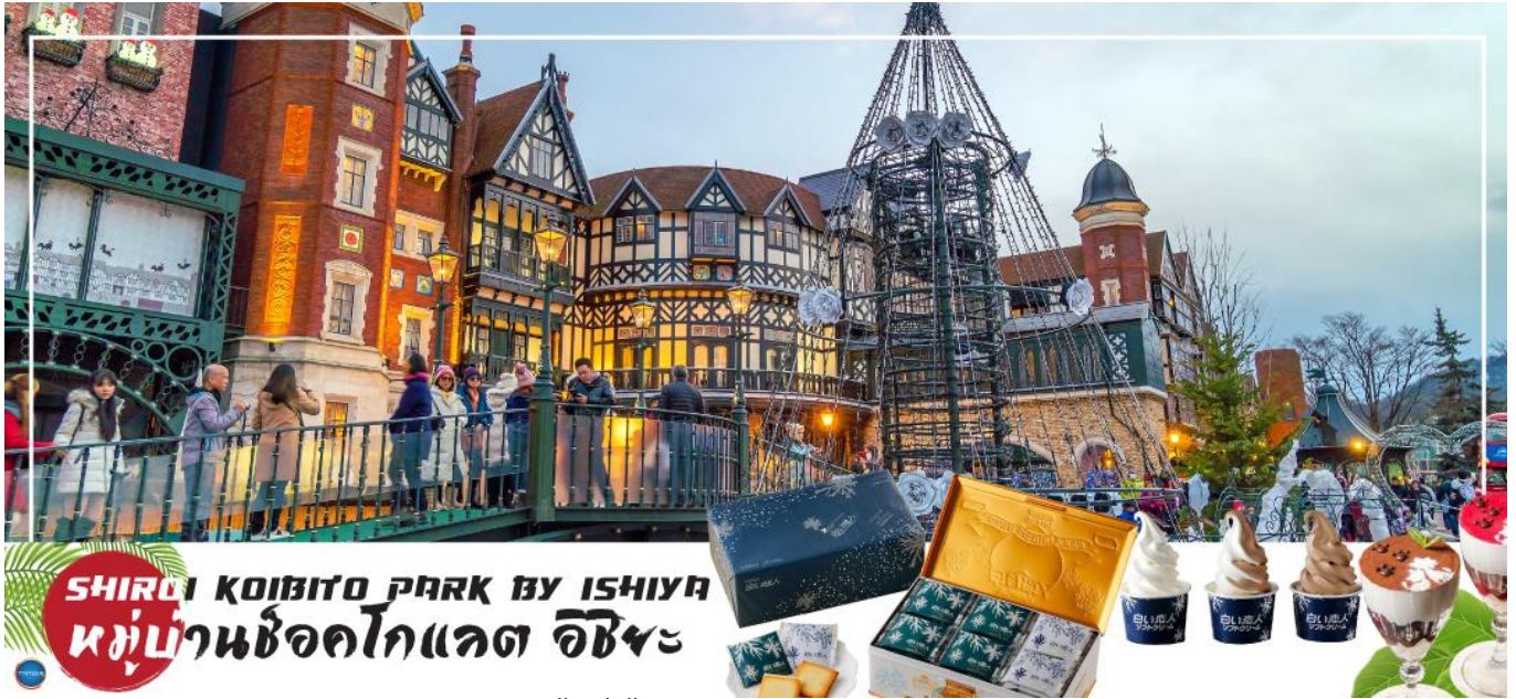
SHIRAI KOIRITO PARK BY ISHIYAMA หมู่บ้านช็อคโกแลต อิชิยะ

นอกจากนี้ท่านจะได้เลือกซื้อช็อคโกแลตที่หาซื้อที่ไหนไม่ได้ และ ท่านก็ยังจะได้ชมประวัติความเป็นมาของโรงงาน และการผลิตช็อคโกแลตอีกด้วย จากนั้นนำท่านสู่ ถนนช้อปปิ้งทานุกิโคจิ (Tanukikoji Shopping Street) เป็นย่านการค้าเก่าแก่