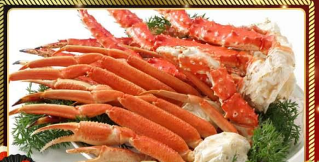
เมนูพิเศษ!! ซูชิไฟต์งปูยักษ์ 3 ชนิด