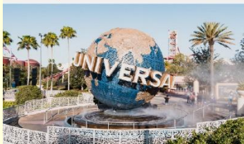
OPTION สวนสนุกยูนิเวอร์เซล