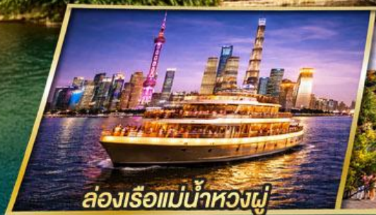
ล่องเรือแม่น้ำหวงผู่