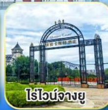
ไร่ไวน์จางยู