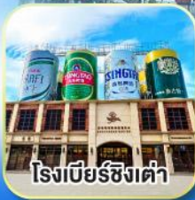
โรงเบียร์ซิงเต่า