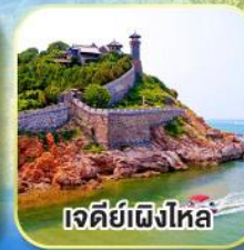
เจดีย์เฝิงโหล