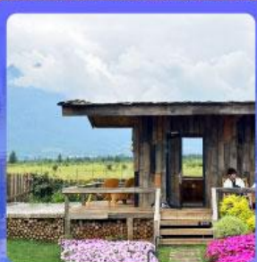
ร้านกาแฟหยุนต้ออัน