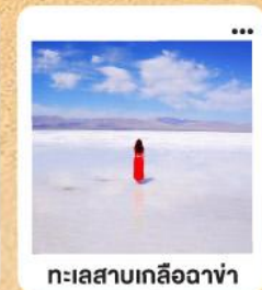
ทะเลสาบเกลือฉางซ่า