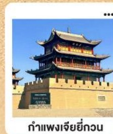
ถ้ำแพงเจียยี่กวน