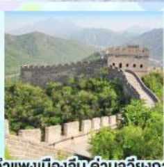
กำแพงเมืองจีน ด้านจวิยงกวน