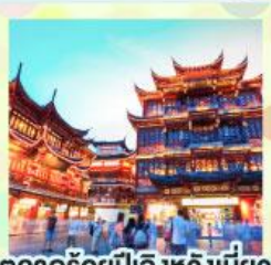
ตลาดร้อยปีเฉิงหวิงเหมียว