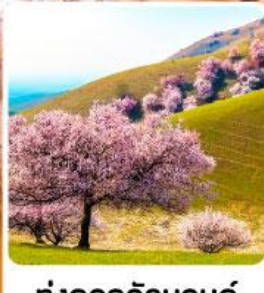
ทุ่งดอกอัลมอนต์