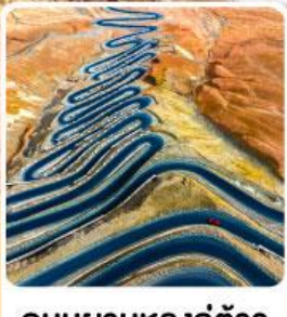
ถนนผานหลงกู่ต้าว