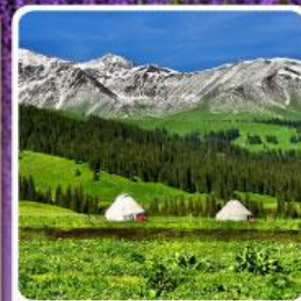
ทุ่งหญ้านาฬิกา