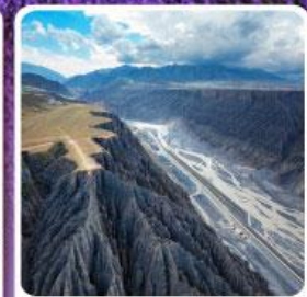
แกรนด์แคนยอนคู่ชานจื่อ