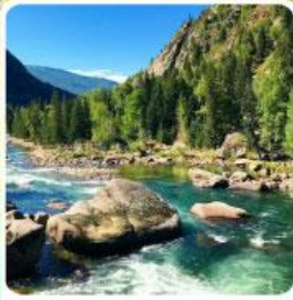
อุทยานเคอเคอทัวไห่