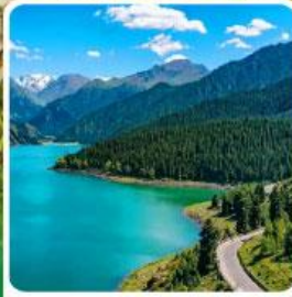
อุทยานเทียนชาน เทียนฉือ