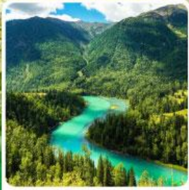
ทะเลสาบคานาสีอ