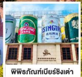
พิพิธภัณฑ์เบียร์ชิงเต่า