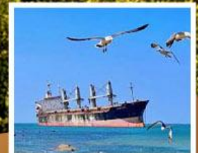
เรือสินค้าเกย์ตันบลูวิส