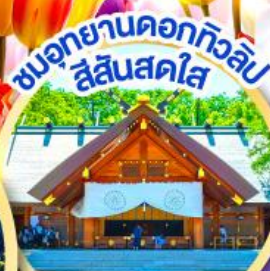
ชมอุทยานดอกทิวลิป สีสดใส