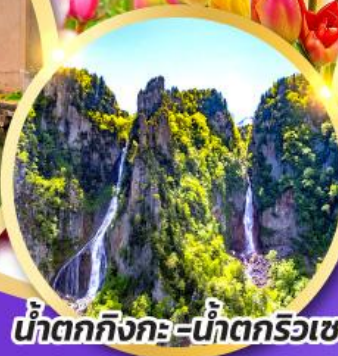
น้ำตกกิ่งกะ-น้ำตกริวเซ