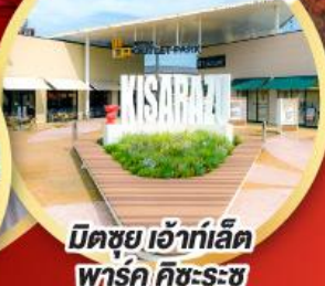
มิตซุซุ เออิเก้ต พาร์ค คิชะระชู