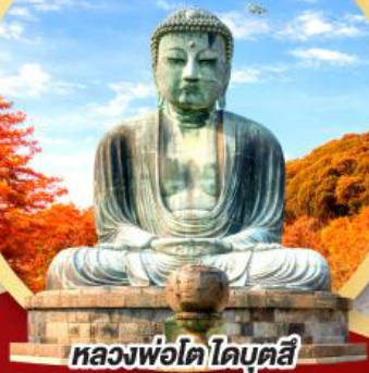
หลวงพ่อดโตโตมุตสึ