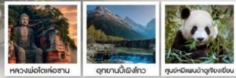
หลวงพ่อดำเสื่อซาน