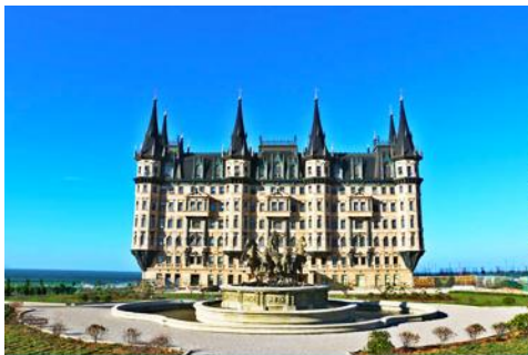
คฤหาสน์เหวินเจิง

นำท่านไปเยือนเมืองท่าสุดโรแมนติคสไตล์ยุโรป ท่าเรือชาวประมง ให้ท่านได้ชมสถาปัตยกรรมสไตล์อเมริกาเหนือ และ ยุโรป ที่ตั้งอยู่ในพื้นที่แผ่นดินจีน ณ เมืองเยียนไถ เก็บบรรยากาศลมทะเล และเก็บรูปกับอาคารหลังคาสี่เหลี่ยมเป็นฉากหลัง ที่เต็มไปด้วยมนต์เสน่ห์และความทรงจำที่สวยงาม ให้ท่านเก็บภาพความสวย