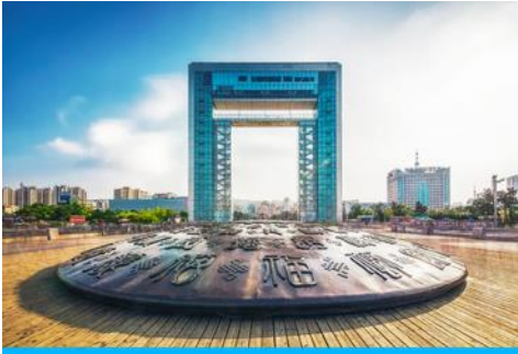
ประตูแห่งโชค

ครบรอบ 100 ปี ของการเปิดท่าเรือเว่ยไห่ จึงขนานนามว่าเป็น ประตูแห่งโชค ที่คอยต้อนรับนักเดินทางทุกท่าน โครงสร้างของประตูที่ตั้งตระหง่านโอบล้อมของท้องทะเลและเกาะหลิวกง อยู่เบื้องหน้า เป็นภาพที่สวยงาม ให้ท่านเก็บบรรยากาศเป็นที่ระลึก จากนั้นเดินทางสู่ภัตตาคาร