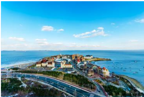
ท่าเรือชาวประมง

08.05 น. ถึงสนามบินเมืองเยียนไถ (เวลาท้องถิ่นเร็วกว่าไทย 1 ชั่วโมง) นำท่านผ่านการตรวจตราเอกสารและรับสัมภาระเรียบร้อย นำท่านเดินทางโดยรถบัสปรับอากาศ เดินทางสู่เมืองเยียนไถ