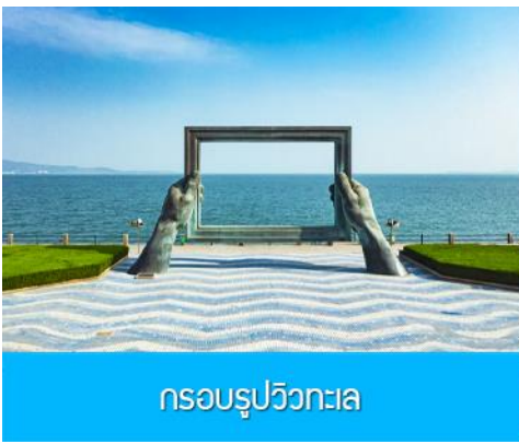
กรอบรูปวิวทะเล