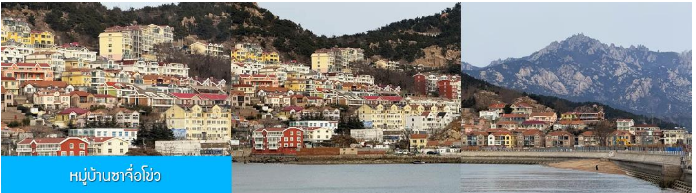
หมู่บ้านซาจื่อโขว่

เที่ยง รับประทานอาหารกลางวัน ณ ภัตตาคาร (มื้อที่ 7)