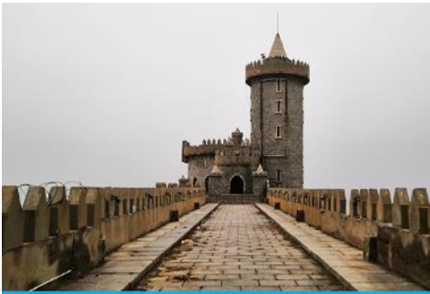
คาเฟ่อีสต