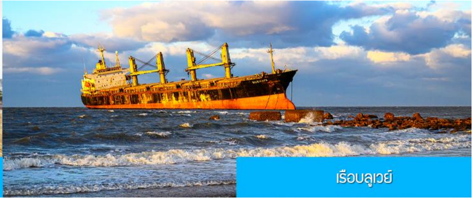
เรือบลูเวย์