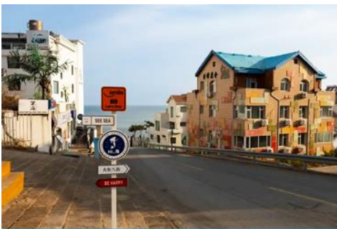
ถนนคอบเพลิงหมายเลข 8

นำท่านจับไวน์ในปราสาทสไตล์ยุโรป หลีกหนีความวุ่นวายและก้าวเข้าสู่ดินแดนที่ราวกับหลุดมาจากเทพนิยายยุโรป ณ ไร่ไวน์ ชาโตว์ ณ คดูลาส์ จางยู๋ ปราสาทไวน์อันโอ่อ่าที่ตั้งตระหง่านกลางไร่องุ่นสุดลูกหูลูกตาในเมืองเยียนไถ มณฑลซานตง ที่นี่คือการบรรจบกันอย่างลงตัวของมรดกการผลิตไวน์กว่าร้อยปีของจีนและความเชี่ยวชาญจากฝรั่งเศส ทำให้เกิดเป็นแหล่งท่องเที่ยวที่ไม่เพียงสวยงามน่าถ่ายรูป แต่ยังเป็นสวรรค์ของคนรักไวน์ นำท่านเดินชมสถาปัตยกรรมคลาสสิก เยี่ยมชมห้องเก็บไวน์ใต้ดินอันลึกลับ และปิดท้ายด้วยการชิมไวน์รสเลิศที่ผลิตจากองุ่นในไร่แห่งนี้ เสริมแต่งประสบการณ์ที่จะทำให้การเดินทางของคุณพิเศษยิ่งขึ้น ปิดท้ายประสบการณ์อันสุดแสนคลาสสิกนี้... ด้วยการ ลิ้มรสไวน์แดง (ท่านละ 1 แก้ว) ที่มีชื่อเสียงของที่นี่, จากนั้น นำท่านเดินทางสู่ เมืองเวย์ไห้ 威海 ตั้งอยู่ปลายสุดของคาบสมุทรซานตง ซึ่งเป็นเมืองท่าสำคัญที่มีชายฝั่งทะเลสวยงามสะอาด อากาศเย็นสบายในฤดูร้อนและมีหิมะตกหนักในฤดูหนาว ได้รับอิทธิพลวัฒนธรรมเกาหลีใต้เนื่องจากที่ตั้งใกล้ที่สุด จุดเด่นคือเกาะหลิวกง เมืองหัวเซียงเฉิง และบรรยากาศเมืองท่าที่พักผ่อนสบาย นำท่านเก็บบรรยากาศกับ กรอบรูปวิวทะเล อีกหนึ่งไฮไลท์สุดฮิตที่มาเวย์ไห้ ต้องถ่ายรูปกับจุดนี้