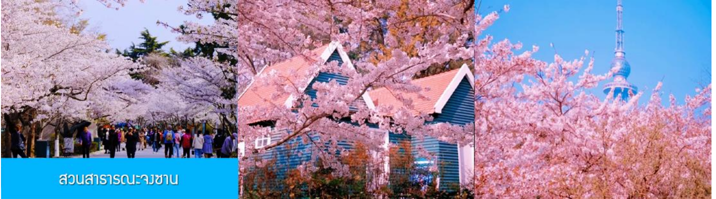
สวนสาธารณะจงชาน

ยุโรปในแผ่นดินจีน และเมืองที่มีวัฒนธรรมที่ผสมผสานทิวทัศน์ชายทะเลที่สวยงาม มีมนต์เสน่ห์อันเป็นเอกลักษณ์เฉพาะตัว (ใช้เวลาเดินทางประมาณ 3 ชั่วโมง)