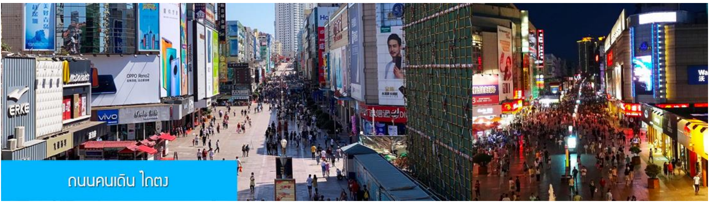
ถนนคนเดิน โถง

จากนั้นนำท่านสู่ ถนนคนเดิน โถง 台东步行街 ย่านการค้าเป็นถนนคนเดินที่ใหญ่และคึกคักของเมืองชิงเต่า ที่นี่เป็นแหล่งรวมร้านค้าสินค้าแฟชั่นร่วมสมัย สินค้าพื้นเมือง ของที่ระลึก และร้านอาหาร บาร์เบียร์ของเมืองชิงเต่ามากมาย, ให้ท่านมีเวลาอิสระเดินเล่น ช้อปปิ้ง ลิ้มรสอาหารพื้นเมือง และเลือกซื้อของฝาก ตามอัธยาศัย เย็น รับประทานอาหารค่ำ ณ ภัตตาคาร เซ็ตปิ้งย่างเกาหลี (มื้อที่ 11) พักที่ Holiday Inn Express Hotel ระดับ 4 ดาว พื้นเมือง