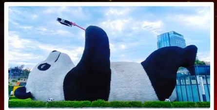
หมีแพนด้าเซลฟี