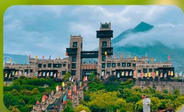
หมู่บ้านโบราณชนเผ่าเซียง