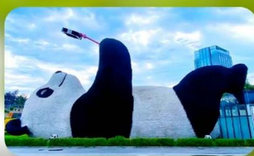
หมีแพนด้าเซลฟ์