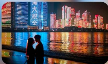
ชายหาดหมายเลข 3