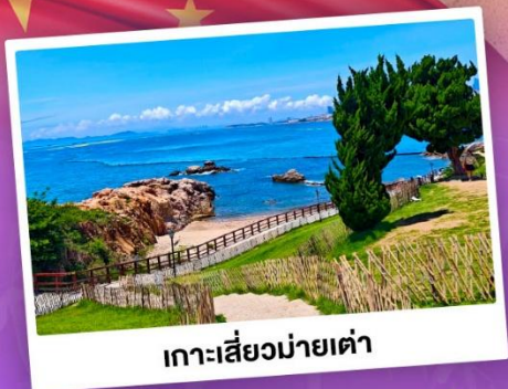
เกาะเสี่ยวมายเต่า