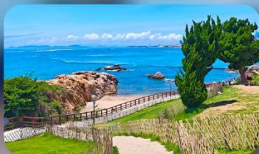
เกาะสี่เหลี่ยมเต่า