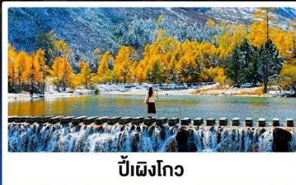
ปี้ฝิงโกว