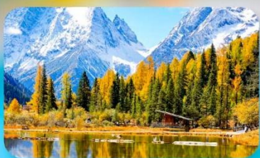
กุเวาสี้ดรุณี