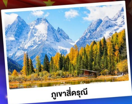
กู๋เจาสีครุณี

ชมบรรยากาศใบไม้เปลี่ยนสี "สถานที่ท่องเที่ยว 5A อุทยานจิวจ้ายโกว"