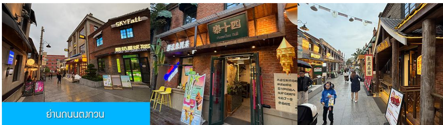
ย่านถนนตงกวน

นำท่านเที่ยวชม จัตุรัสชิงไห่ 星海广场 เป็นจัตุรัสขนาดใหญ่เป็นแลนด์มาร์คสำคัญของเมืองต้าเหลียน สร้างขึ้นเพื่อเฉลิมฉลองในโอกาสที่รัฐบาลอังกฤษคืนเกาะฮ่องกงในให้จีนในปี ค.ศ. 1997 ตั้งอยู่ชายฝั่งทะเลในเมืองต้าเหลียน เป็นจัตุรัสใจกลางเมืองที่ใหญ่ที่สุดในโลกและเป็นแลนด์มาร์คของเมืองต้าเหลียน รายล้อมด้วยตึกระฟ้าที่ทันสมัย ภายในมีบ่อน้ำพุดนตรี ลานหญ้าขนาดใหญ่ และลานกว้างสำหรับจัดกิจกรรมกลางแจ้ง อาทิ เทศกาลเบียร์นานาชาติ การแข่งขันวิ่งมาราธอน งานแฟชั่นนานาชาติเมืองต้าเหลียน ฯลฯ