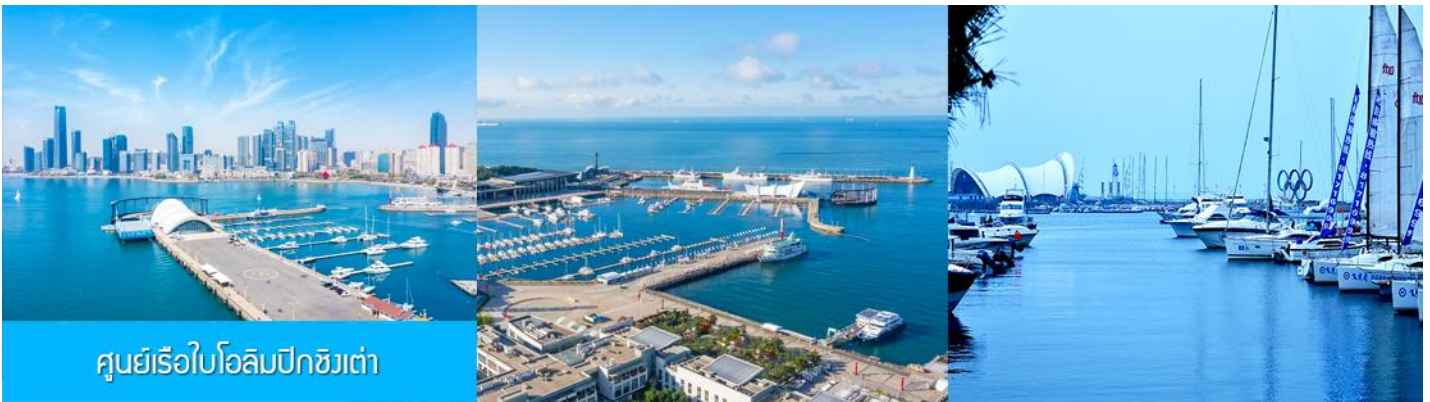
ศูนย์เรือใบโอลิมปิกชิงเต่า

จากนั้นนำท่านเที่ยวชม โรงเบียร์ชิงเต่า 青岛啤酒博物馆 พิพิธภัณฑ์เบียร์ที่ขึ้นชื่อของเมืองชิงเต่า ซึ่งเป็นเบียร์ยี่ห้อแรกที่ผลิตขึ้นในประเทศจีน ชมเบียร์ คอลเลกชันที่มียี่ห้อหลากหลายที่สุดของโลก และชมการจัดแสดงภาพและวีดิทัศน์เกี่ยวกับวิวัฒนาการของเบียร์ ขั้นตอนการผลิตและอื่น ๆ ที่เกี่ยวข้อง พร้อมชิมเบียร์ชิงเต่า ซึ่งเป็นเบียร์ที่ขายดีที่สุดยี่ห้อหนึ่งของจีน.. (ชิมเบียร์ชิงเต่าท่านละ 1 แก้ว รับกกลับอีก 1 ขวดเล็ก ตอนเดินออก)