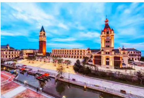
เมืองเวนิสตะวันออก