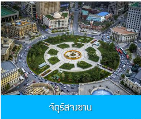
จัตุรัสวงเวียน