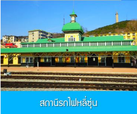
สถานีรถไฟหลี่ซุ่น