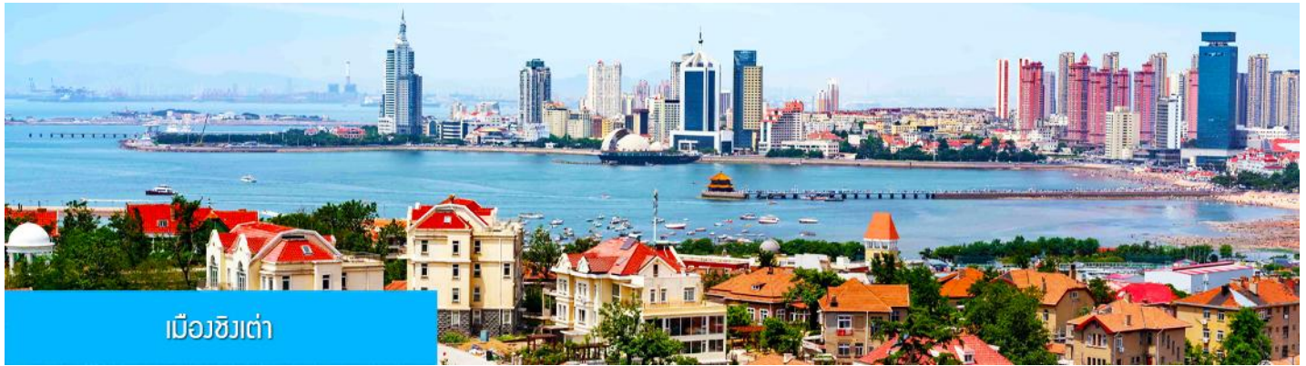
เมืองชิงเต่า