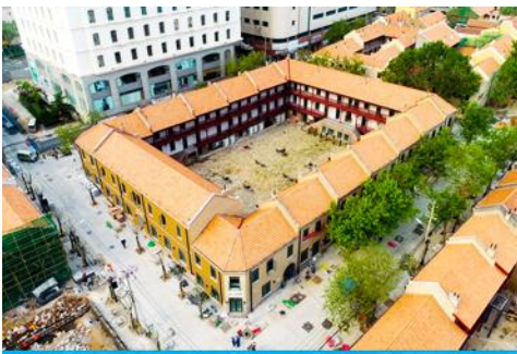
เมืองเก่าเยอรมัน ตรอกกว้างชิงหลี่

จากนั้นนำท่านเดินเที่ยวชม ถนนจงชาน 中山路 ถนนที่เต็มไปด้วยกลิ่นอายยุโรป และถนนสายนี้มีบันทึกเรื่องราวมากกว่าศตวรรษของเมืองชิงเต่าไว้ ที่นี่เป็นศูนย์กลางการค้าแห่งแรกที่เต็มไปด้วยสถาปัตยกรรมสไตล์ยุโรปเก่าแก่ที่ได้รับอิทธิพลมาจากเยอรมัน ให้ท่านได้เดินเก็บบรรยากาศ และ เก็บภาพกับ โบสถ์เซนต์ไมเกิล (ด้านนอก) โบสถ์แห่งนี้ที่คู่รักนิยมมาถ่ายภาพงานแต่งงานมากที่สุดในเมืองชิงเต่า ให้ท่านถ่ายรูปเก็บภาพ