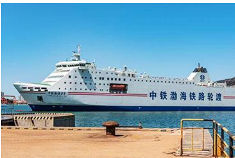
เรือ ZHONGTIE BOHAI CRUISE