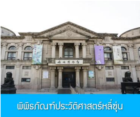
พิพิธภัณฑ์ประวัติศาสตร์หลี่ซุ่น

นำท่านเที่ยวชมและเก็บภาพ ณ สถานีรถไฟหลี่ซุ่น 旅顺火车站 เป็นสถานีปลายทางของเส้นทางรถไฟสาขาเส้นหยาง - ต้าเหลียน สร้างขึ้นในปีค.ศ. 1903 ออกแบบโดยสถาปนิกชาวรัสเซีย เป็นอาคารอิฐก่อปูนผสมโครงสร้างไม้ตามสถาปัตยกรรมรัสเซีย.