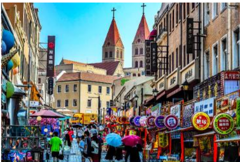
ถนนจางซาน