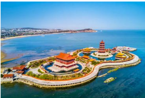
อุทยานท่องเที่ยวแปดเซียนข้ามทะเล