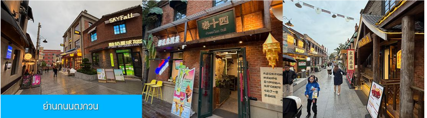
ย่านถนนตวงกวน

หลังอาหารนำท่านเที่ยวชม จัตุรัสชิงไห่ 星海广场 เป็นจัตุรัสขนาดใหญ่เป็นแลนด์มาร์คสำคัญของเมืองต้าเหลียน สร้างขึ้นเพื่อเฉลิมฉลองในโอกาสที่รัฐบาลอังกฤษคืนเกาะฮ่องกงโนให้จีนในปี ค.ศ. 1997 ตั้งอยู่ชายฝั่งทะเลในเมืองต้าเหลียน เป็นจัตุรัสใจกลางเมืองที่ใหญ่ที่สุดในโลกและ เป็นแลนด์มาร์คของเมืองต้าเหลียน รายล้อมด้วยตึกระฟ้าที่ทันสมัย ภายในมีบ่อน้ำพุดนตรี ลานหญ้าขนาดใหญ่ และลานกว้างสำหรับจัดกิจกรรมกลางแจ้ง อาทิ เทศกาลเบียร์นานาชาติ การแข่งขันวิ่งมาราธอน งานแฟชั่นนานาชาติเมืองต้าเหลียน ฯลฯ