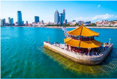
สะพานจ้านเจียว