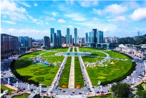
จัตุรัสซิงไห่

เช้า รับประทานอาหารเช้า ณ ห้องอาหารของโรงแรม (1)