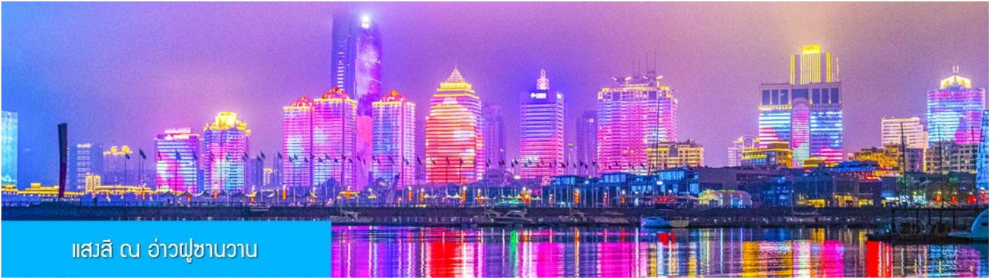
แสงสี ณ อ่าวฟู่ซานวาน

หลังอาหารนำท่านชมความอลังการของแสงสี ณ อ่าวฟู่ซานวาน 浮山湾灯光秀 ชมความอลังการของแสงสียามหัวค่ำ และไฟที่เด่นระบำได้บนตึกสูง และเป็นหนึ่งในไนท์วิวที่สวยงามที่สุดแห่งหนึ่งของจีน..... พักที่ JIFENG HOTEL / KAILAIZHIHUI HOTEL โรงแรมระดับ 4 ดาวท้องถิ่น เมืองชิงเต่า