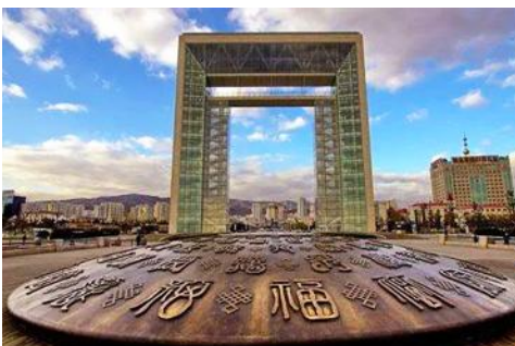
ประตูแห่งโชคกลาง