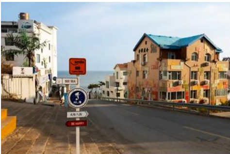
ถนนคบเพลิงหมายเลข 8

นำท่านชมสวนสาธารณะเวย์ไห่ 威海公园 สวนสาธารณะริมทะเลที่ใหญ่ที่สุดของเมืองเวย์ไห่ ให้ท่านชมและถ่ายภาพคู่กับ กรอบรูปยักษ์วิวทะเล 威海公园大相框 แลนด์มาร์คที่เป็นอีกหนึ่งไฮท์ไลท์ฮิตของเมืองเวย์ไห่