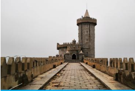
คาเฟ่อีสต