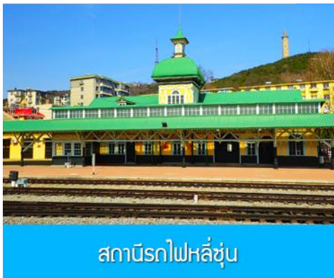
สถานีรถไฟหลี่ซุ่น

05.00 น. เรือท่องเที่ยวนำคณะเดินทางถึงท่าเรือเมืองต้าเหลียน นำท่านขึ้นรถบัสเพื่อเดินทางสู่ตัวเมืองต้าเหลียน เช้า รับประทานอาหารเช้า ณ ห้องอาหาร (7)