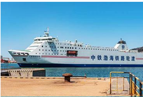
เรือ ZHONGTIE BOHAI CRUISE