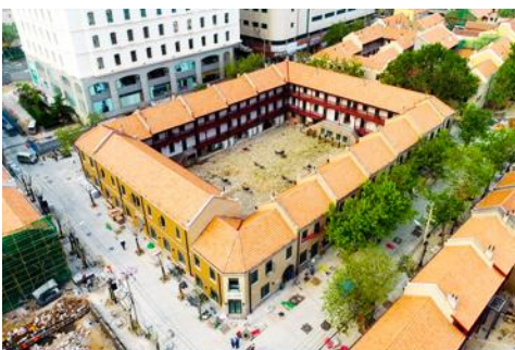
เมืองเก่าเยอรมัน ตรอกกว้างชิงหลี่

จากนั้นนำท่านเดินเที่ยวชม ถนนจงซาน 中山路 ถนนที่เต็มไปด้วยกลิ่นอายยุโรป และถนนสายนี้มีบันทึกเรื่องราวมากกว่าศตวรรษของเมืองชิงเต่าไว้ ที่นี่เป็นศูนย์กลางการค้าแห่งแรกที่เต็มไปด้วยสถาปัตยกรรมสไตล์ยุโรปเก่าแก่ที่ได้รับอิทธิพลมาจากเยอรมัน ให้ท่านได้เดินเก็บบรรยากาศ และ เก็บภาพกับ โบสถ์เซนต์ไมเกล (ชมด้านนอก) โบสถ์แห่งนี้ที่คู่รักนิยมมาถ่ายภาพงานแต่งงานกันมากที่สุดในเมืองชิงเต่า ให้ท่านถ่ายรูปเก็บภาพ