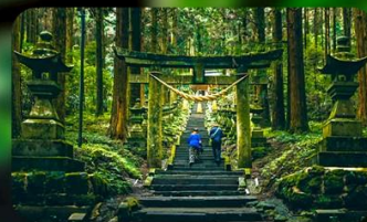
ศาลเจ้าคามิชิกิมิ