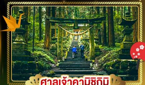
🏯 ศาลเจ้าคามิซึกิมิ