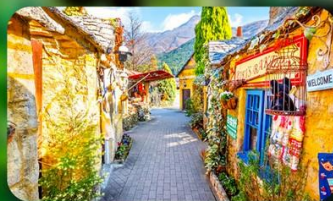
หมู่บ้านยูฟุอิน