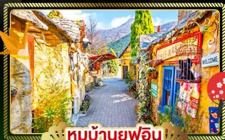
🏠 หมู่บ้านยูฟุอิน