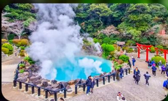
บ่อยูมิจิโกกุ

FUKUOKA AREA หรือเทียบเท่ามาตรฐานญี่ปุ่น