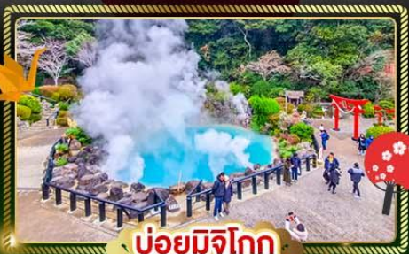
♨️ บ่อยุมิจิโอกุ