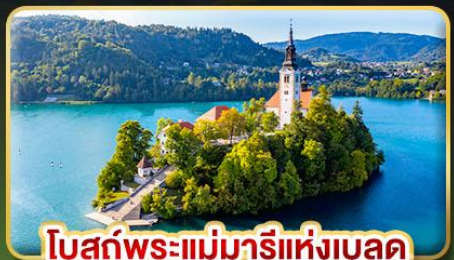
โบสถ์พระแม่มาเรียแห่งบลัด