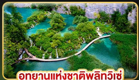
อุทยานแห่งชาติพลิตวิเช