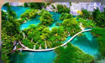
อุทยานแห่งชาติพลิตวิเซ่