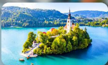
โบสถ์พระแม่มาเรียแห่งเบลค