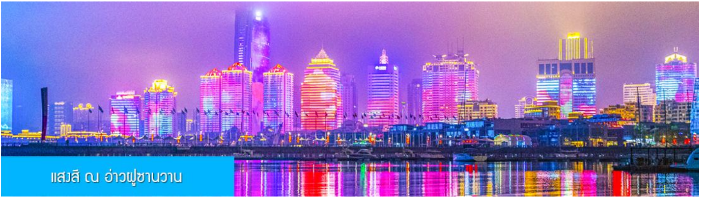
แสงสี ณ อ่าวฝูซานวาน