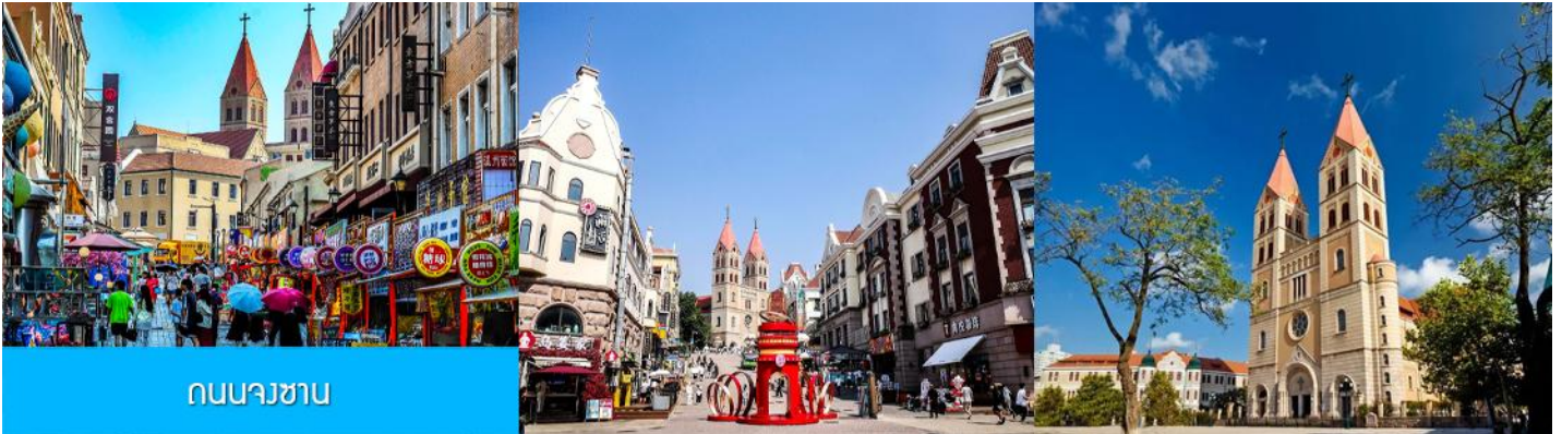
ถนนวาชาน

หลังอาหารนำท่านเดินทางชมสะพานจ้านเถียว 栈桥 เป็นแลนด์มาร์กแห่งประวัติศาสตร์คู่เมืองชิงเต่า สร้างเมื่อปี ค.ศ.1891 มีลักษณะเป็นสะพานหินทอดยาวกว่า 440 เมตรสู่ทะเล ปลายสะพานมีศาลา ทรงแปดเหลี่ยมสีแดงที่โดดเด่น ซึ่งเป็นสัญลักษณ์บนฉลากเบียร์ชิงเต่า ขึ้นชื่อเรื่องวิวสวย รับลมทะเล ให้ท่านเก็บภาพบรรยากาศ