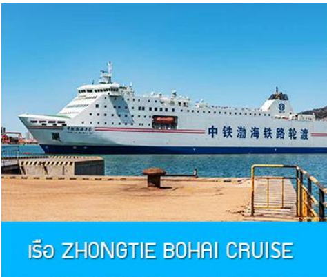
เรือ ZHONGTIE BOHAI CRUISE