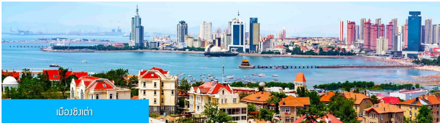
เมืองชิงเต่า