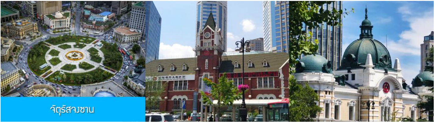
จัตุรัสวงเวียน