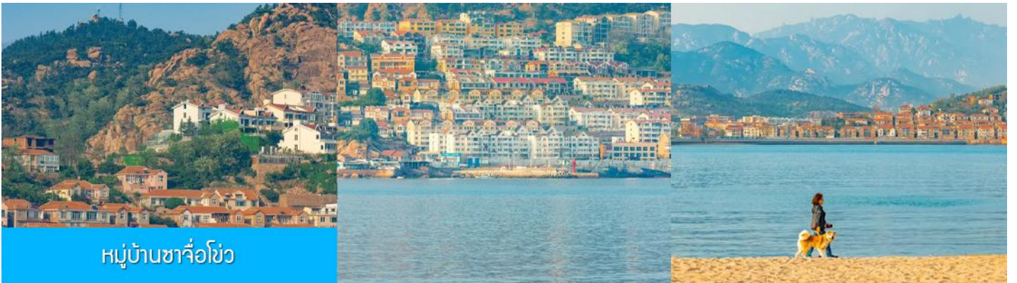
หมู่บ้านซาจื่อโข่ว

เช้า รับประทานอาหารเช้า ณ ห้องอาหารของโรงแรม (4)