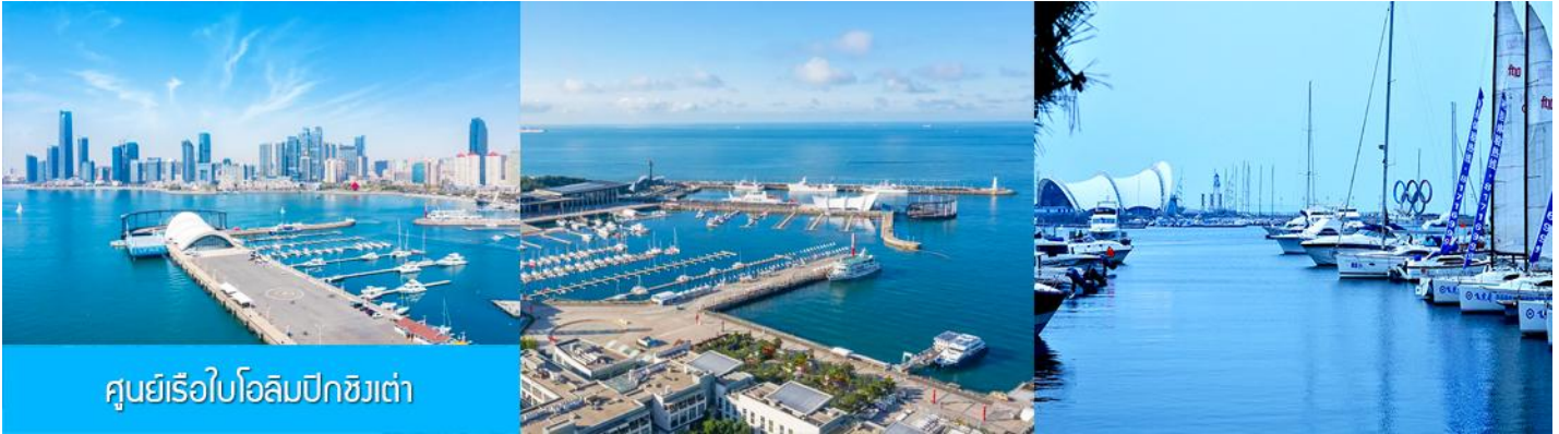
ศูนย์เรือใบโอลิมปิกชิงเต่า

จากนั้นนำท่านเที่ยวชม โรงเบียร์ชิงเต่า 青岛啤酒博物馆 พิพิธภัณฑเบียร์ที่ขึ้นชื่อของเมืองชิงเต่า ซึ่งเป็นเบียร์ยี่ห้อแรกที่ผลิตขึ้นในประเทศจีน ชมเบียร์ คอลเลกชันที่มียี่ห้อหลากหลายที่สุดของโลก และชมการจัดแสดงภาพและวิดิทัศน์เกี่ยวกับวิวัฒนาการของเบียร์ ขั้นตอนการผลิตและอื่น ๆ ที่เกี่ยวข้อง พร้อมชิมเบียร์ชิงเต่า ซึ่งเป็นเบียร์ที่ขายดีที่สุดในยี่ห้อหนึ่งของจีน.. (ชิมเบียร์ชิงเต่าท่านละ 1 แก้ว รับกลับอีก 1 ขวดเล็ก ตอนเดินออก)