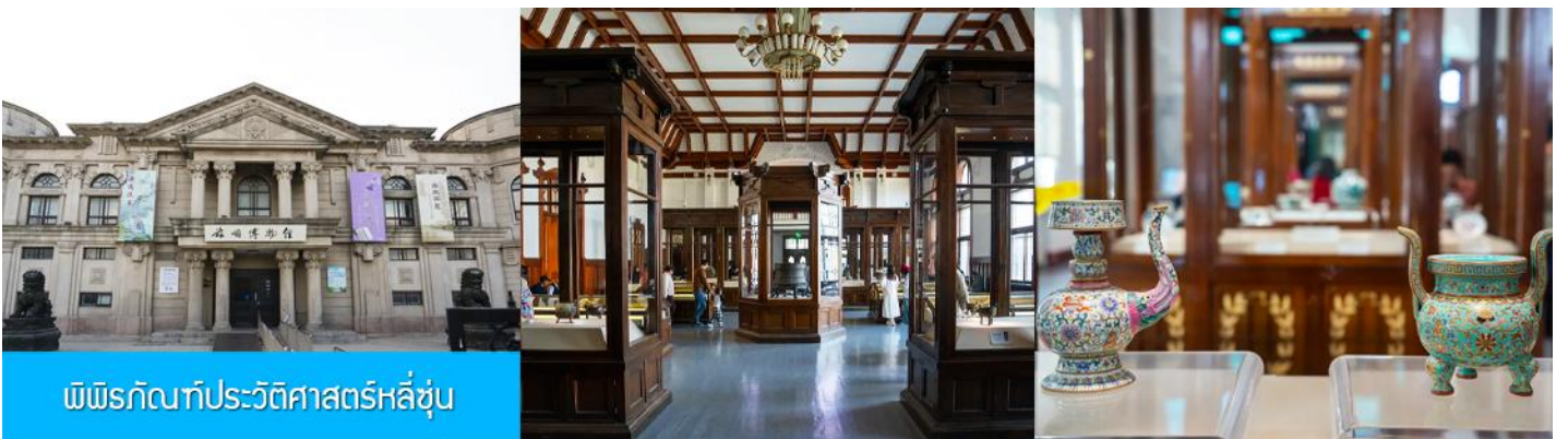
พิพิธภัณฑสถานประวัติศาสตร์หลี่ซุ่น

นำท่านเที่ยวชมและเก็บภาพ ณ สถานีรถไฟหลี่ซุ่น 旅顺火车站 เป็นสถานีปลายทางของเส้นทางรถไฟสาขา เส้นหยาง - ต้าเหลียน สร้างขึ้นในปีค.ศ. 1903 ออกแบบโดยสถาปนิกชาวรัสเซีย เป็นอาคารอิฐก่อปูนผสม โครงสร้างไม้ตามสถาปัตยกรรมรัสเซีย.