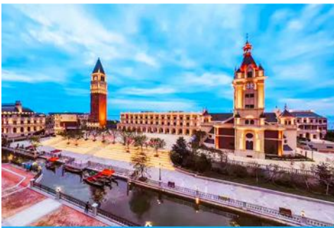
เมืองเวนิสตะวันออก