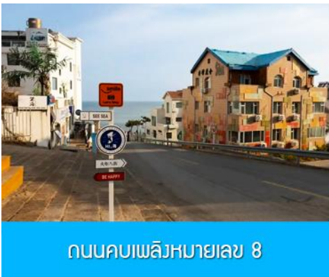
ถนนคอบเพลิงหมายเลข 8

นำท่านชมสวนสาธารณะเวย์ไห่ 威海公园 สวนสาธารณะริมทะเลที่ใหญ่ที่สุดของเมืองเวย์ไห่ ให้ท่านชมและถ่ายภาพคู่กับ กรอบรูปยักษ์วิวทะเล 威海公园大相框 แลนด์มาร์คที่เป็นอีกหนึ่งไฮไลท์ที่สุดฮิตของเวย์ไห่