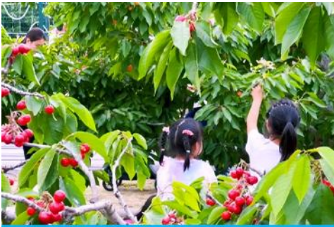
สวนเชอร์รี่