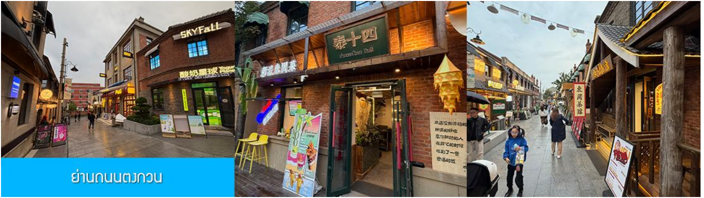
ย่านถนนตวงกวน

นำท่านเที่ยวชม จัตุรัสชิงไห่ 星海广场 เป็นจัตุรัสขนาดใหญ่เป็นแลนด์มาร์คสำคัญของเมืองต้าเหลียน สร้างขึ้นเพื่อเฉลิมฉลองในโอกาสที่รัฐบาลอังกฤษคืนเกาะฮ่องกงในให้จีนในปี ค.ศ. 1997 ตั้งอยู่ชายฝั่งทะเลในเมืองต้าเหลียน เป็นจัตุรัสใจกลางเมืองที่ใหญ่ที่สุดในโลกและเป็นแลนด์มาร์คของเมืองต้าเหลียน รายล้อมด้วยตึกกระจกไฟที่ทันสมัย ภายในมีบ่อน้ำพุดนตรี ลานหญ้าขนาดใหญ่ และลานกว้างสำหรับจัดกิจกรรมกลางแจ้ง อาทิ เทศกาลเบียร์นานาชาติ การแข่งขันวิ่งมาราธอน งานแฟชั่นนานาชาติเมืองต้าเหลียน ฯลฯ