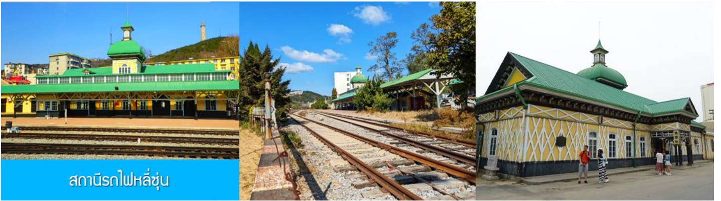
สถานีรถไฟหลี่ซุ่น

นำท่านเที่ยวชมและเก็บภาพ ณ สถานีรถไฟหลี่ซุ่น 旅顺火车站 เป็นสถานีปลายทางของเส้นทางรถไฟสาขา เส้นหยาง - ต้าเหลียน สร้างขึ้นในปีค.ศ. 1903 ออกแบบโดยสถาปนิกชาวรัสเซีย เป็นอาคารอิฐก่อปูนผสม โครงสร้างไม้ตามสถาปัตยกรรมรัสเซีย.