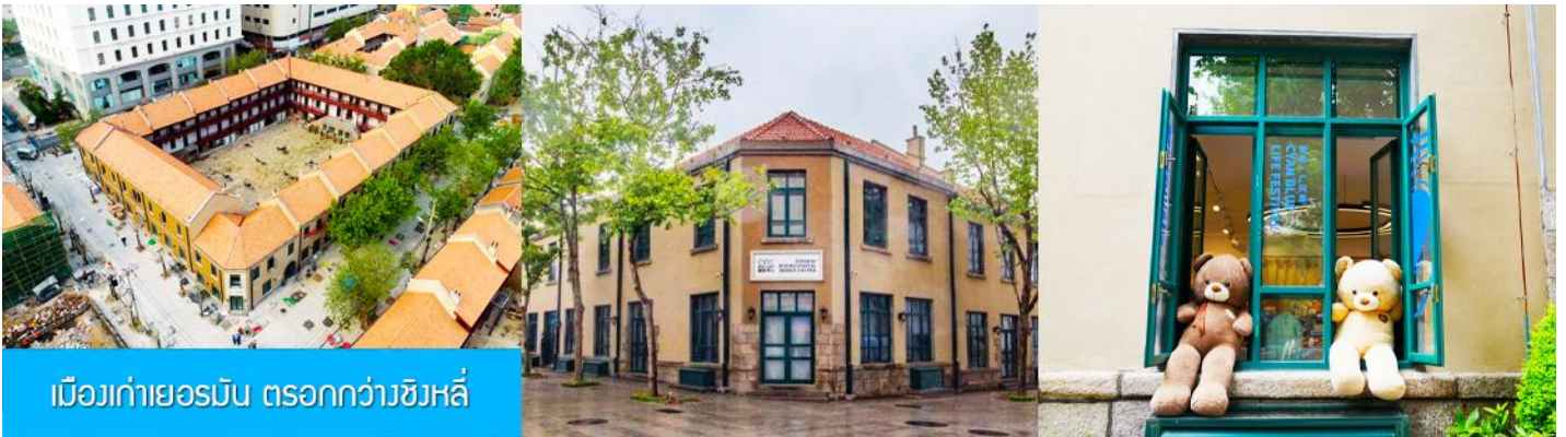
เมืองเก่าเยอรมัน ตรอกกว้างชิงหลี่

จากนั้นนำท่านเดินเที่ยวชม ถนนจงซาน 中山路 ถนนที่เต็มไปด้วยกลิ่นอายยุโรป และถนนสายนี้มีบันทึกเรื่องราวมากกว่าศตวรรษของเมืองชิงเต่าไว้ ที่นี่เป็นศูนย์กลางการค้าแห่งแรกที่เต็มไปด้วยสถาปัตยกรรมสไตล์ยุโรปเก่าแก่ที่ได้รับอิทธิพลมาจากเยอรมัน ให้ท่านได้เดินเก็บบรรยากาศ และ เก็บภาพกับโบสถ์เซนต์ไมเกล (ด้านนอก) โบสถ์แห่งนี้ที่คู่รักนิยมมาถ่ายภาพงานแต่งงานมากที่สุดในเมืองชิงเต่า ให้ท่านถ่ายรูปเก็บภาพ