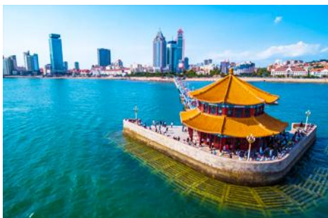
สะพานเคียนเฉียว