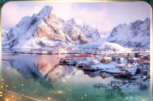
หมู่บ้านเรนเน

นอร์เวย์ แสงเหนือสุดฟิน เซ็คอินสุดกว้าง 10 วัน 7 คืน