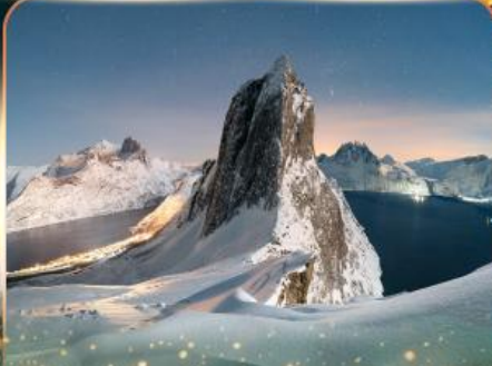
เกาะเซนต์ญา