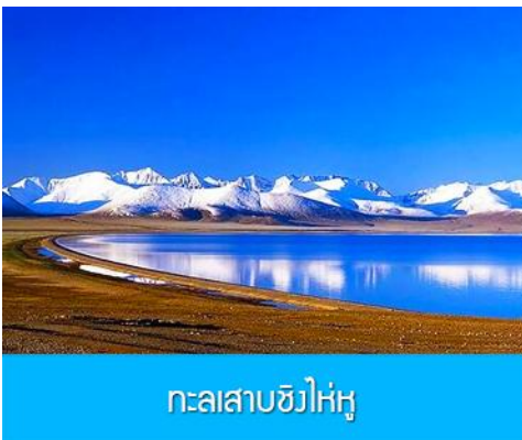
ทะเลสาบชิงไห่หู