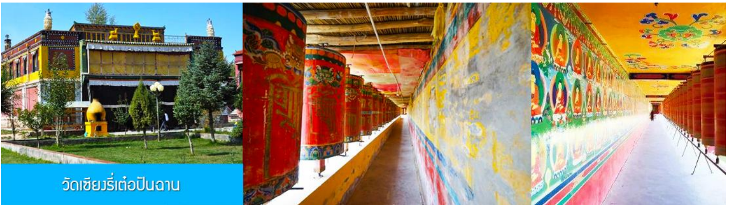
วัดเซียงรีเต๋อปิ่นฉาน