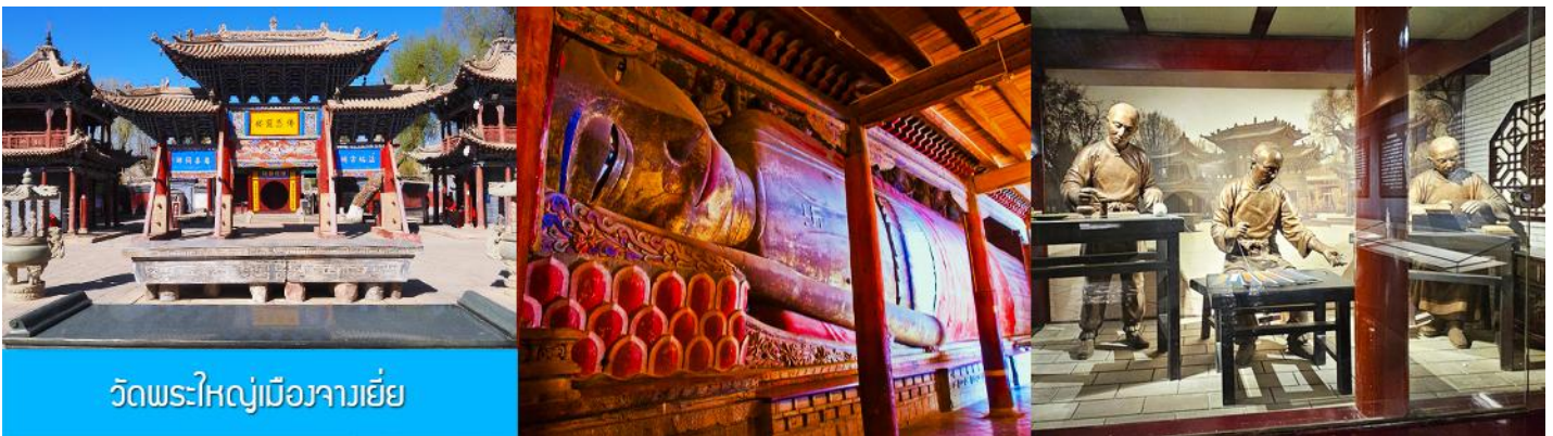
วัดพระใหญ่เมืองจางเยี่ย

รับประทานอาหารเช้า ณ ห้องอาหารของโรงแรม (15)