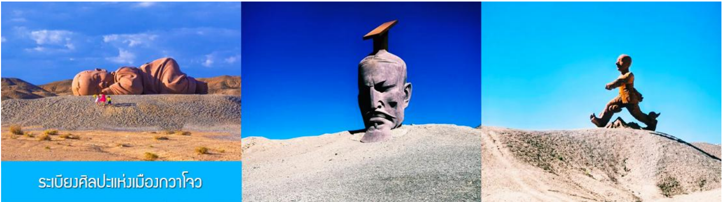
ระเบียบศิลปะแห่งเมืองกวาโจว