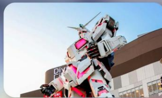
ช้อปปิงโอไดบะ