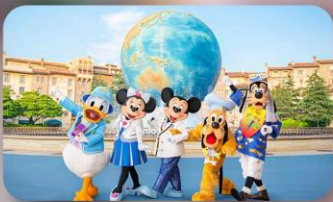
อิสระตามอริยาศัย 2 วัน

HOTEL ASIA NARITA หรือเทียบเท่ามาตรฐานญี่ปุ่น