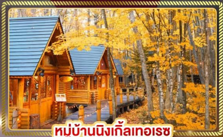
หมู่บ้านนิงเกิ้ลทอเรซ