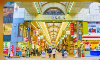
ซูปป์ิงถนนนาทุกิโคจิ