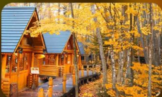
หมู่บ้านนิงเก็ลทอเรซ

SAPPORO TOKYU REI หรือเทียบเท่ามาตรฐานญี่ปุ่น