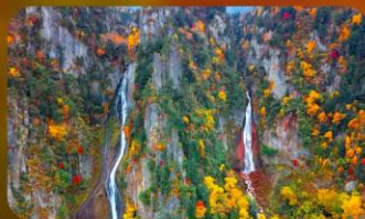
น้ำตกกิงกะ และน้ำตกริวเซ