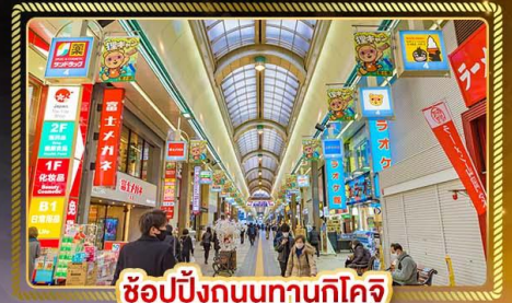
ช้อปปิ้งถนนทานุกุโคจิ