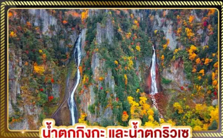
น้ำตกทิงกะ และน้ำตกริวเซ