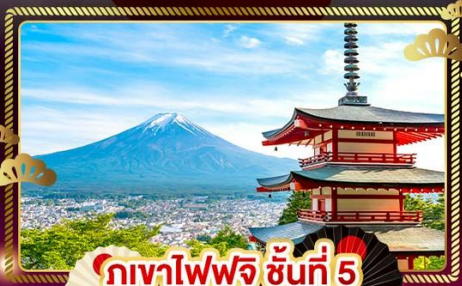
ภูเขาไฟฟูจิ ชั้นที่ 5