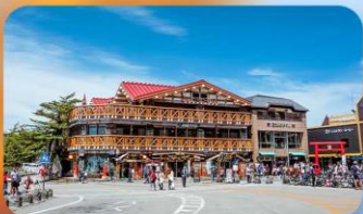
ภูเขาไฟฟูจิ ชั้นที่ 5

INTERNATIONAL RESORT HOTEL YURAKUJO NARITA หรือเทียบเท่ามาตรฐานญี่ปุ่น