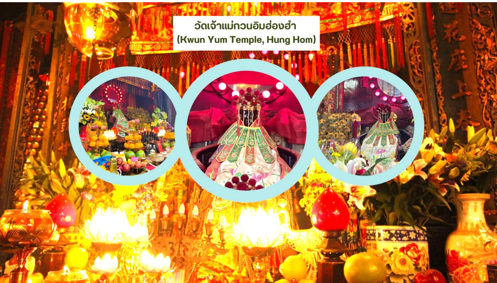
วัดเจ้าแม่กวนอิมฮ่องกง (Kwun Yum Temple, Hung Hom)

นำท่านเดินทางสู่ วัดเจ้าแม่กวนอิมฮ่องกง (Kwun Yum Temple, Hung Hom) เป็นวัดเล็กๆ อันเก่าแก่ ถูกสร้างมาตั้งแต่ปี พ.ศ. 2416 วัดนี้เคยมีปาฏิหาริย์เกิดขึ้น เมื่อช่วงสงครามโลกครั้งที่ 2 มีการปล่อยระเบิดลงบริเวณวัดฮ่องกงหลายต่อหลายครั้ง ซึ่งทำให้มีผู้บาดเจ็บล้มตายเป็นจำนวนมากทว่าชาวบ้านที่เข้าไปหลบภัยในวัดฮ่องกงกลับปลอดภัยไม่ได้รับความบาดเจ็บ รวมถึงตัววัดก็ไม่ได้รับความเสียหายแบบน่าเหลือเชื่อ จึงทำให้ชาวบ้านศรัทธาและเลื่อมใสในวัดแห่งนี้มากยิ่งขึ้น และมีลักษณะสถาปัตยกรรมแบบวัดจีนดั้งเดิม วัดแห่งนี้มีชื่อเสียงโด่งดังในเรื่องของ “พิธียืมเงินเทพเจ้า” เพื่อให้เราร่ำรวยเงินทอง เงินไหลกองทองไหลมา โดยปกติทางวัดจะมีการจัดเทศกาลพิธียืมเงินเทพเจ้าโดยเฉพาะ แต่นอกจากนั้นในวันปกติก็สามารถมาทำพิธีขอได้ตามปกติ