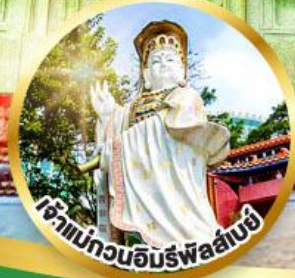
เจ้าแม่กวนอิมร่ำพลัสน้อย