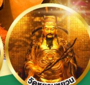
วัดหยวนหยวน

ขอพรเรื่องสุขภาพ, โชคลาภ ความเจริญก้าวหน้า