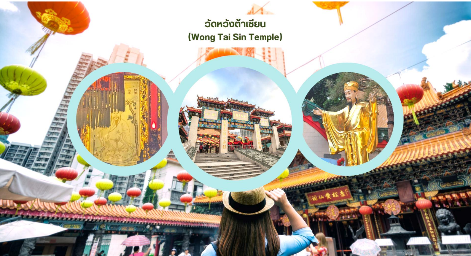
วัดหวังต้าเซียน (Wong Tai Sin Temple)

เช้า รับประทานอาหารเช้า ณ ภัตตาคาร บริการท่านด้วยเมนูติ่มซำฮ่องกง (มื้อที่ 2)