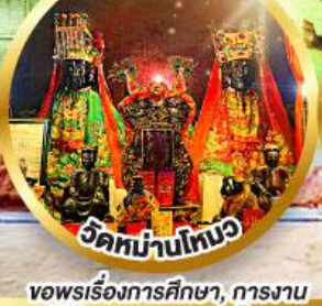
วัดหมู่บ้านไทวอ

ขอพรเรื่องการศึกษา, การงาน สติปัญญาและความกล้าหาญ