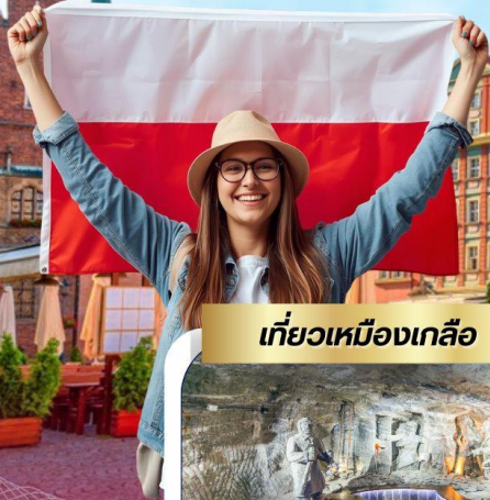
เที่ยวเมืองเกลิอ