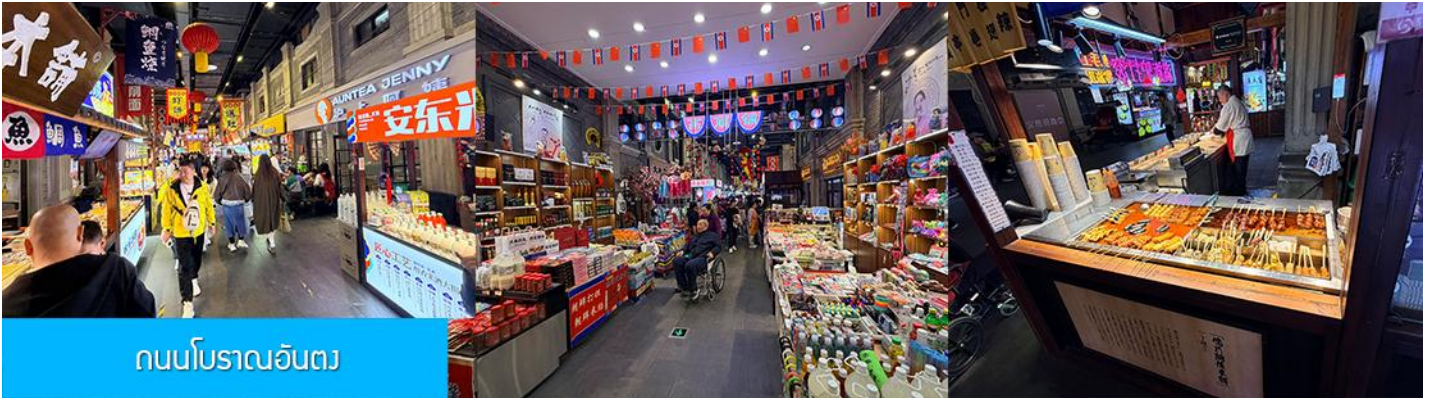
ถนนโบราณอันตง

จากนั้นนำท่านเที่ยวชม ถนนโบราณอันตง 安东老街 ถนนโบราณนี้เริ่มมีชื่อเสียงในฐานะเป็นย่านการค้าที่คึกคักที่สุดในใจกลางเมืองอันตง (ภายหลังได้เปลี่ยนชื่อเป็นคันทง) ในปีค.ศ. 1876 ในสมัยราชวงศ์ชิง ปัจจุบันถนนสายนี้ยังคงไว้ซึ่งอาคารบ้านเรือนยุคเก่า(ราชวงศ์ชิง) และอบอวลด้วยวัฒนธรรมพื้นเมือง โบราณ ท่านจะได้สัมผัสการละเล่นและการแสดงพื้นเมือง ร้านค้าจำหน่ายของที่ระลึก ร้านอาหารท้องถิ่น และสตรีทฟู้ด ฯลฯ