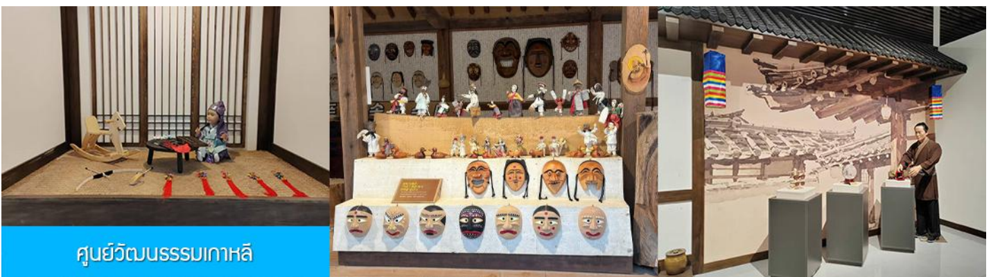
ศูนย์วัฒนธรรมเกาหลี

เช้า รับประทานอาหารเช้า ณ ห้องอาหารของโรงแรม (9)