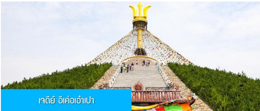
เจดีย์ อี้เค่ออ๋าเป่า

พักที่ DALAETQI SHNAGJING HOTEL โรงแรมระดับ 4 ดาวหรือเทียบเท่าในเมืองต้าลาเท่อ