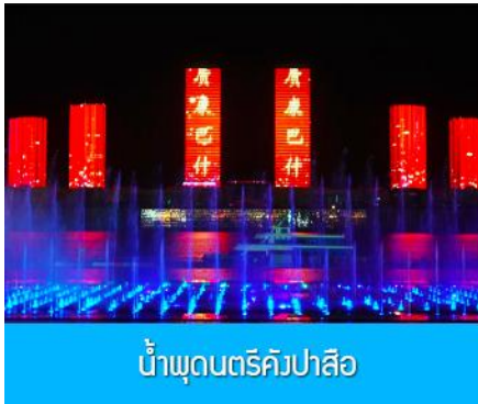
น้ำพุดนตรีคังปาสื่อ