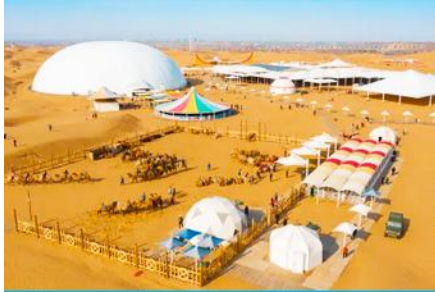
เกาะกลางทะเลทรายเซียนซาเต๋า