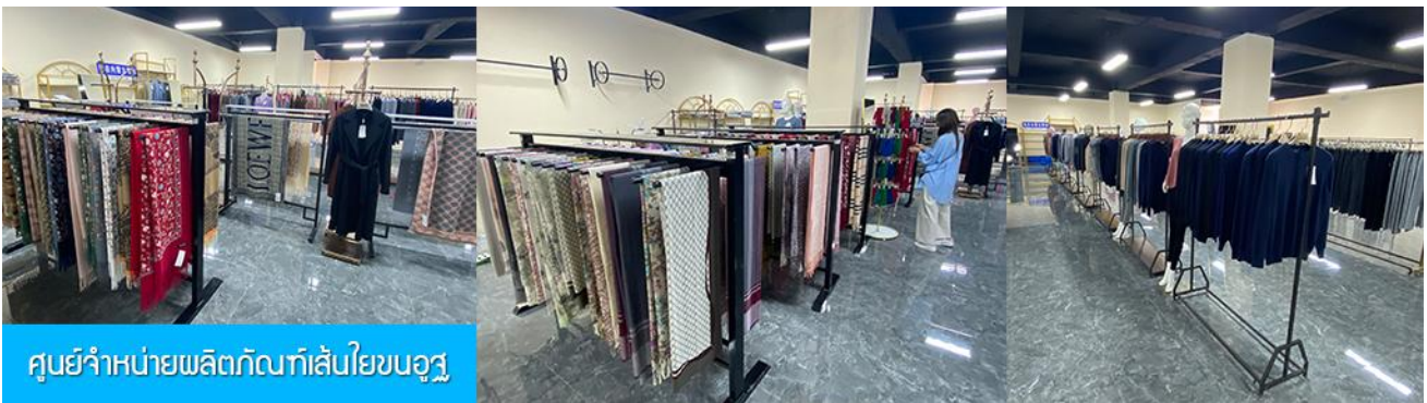
ศูนย์จำหน่ายผลิตภัณฑ์เส้นใยขนอูฐ

พักที่ ORDOS GLASSLAND MONGOLIAN YURT เป็นห้องพักสไตล์มอองโกเลีย (กระโจม)