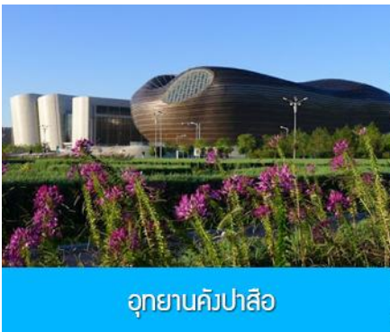
อุทยานคังปาลิโอ