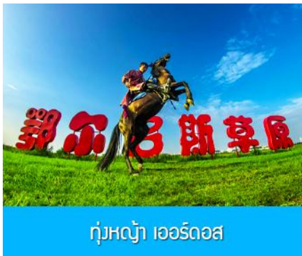
ทุ่งหญ้า เออร์ดอส

พักที่ ORDOS BOYU AIRUI HOTEL โรงแรมระดับ 4 ดาวท้องถิ่น หรือเทียบเท่าในเมืองเออร์ดอส