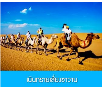
เบ็นทรายเสี่ยชวาน

เที่ยง รับประทานอาหารกลางวัน ณ ภัตตาคาร (11)