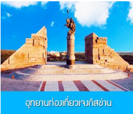
อุทยานท่องเที่ยวเจงกิสข่าน