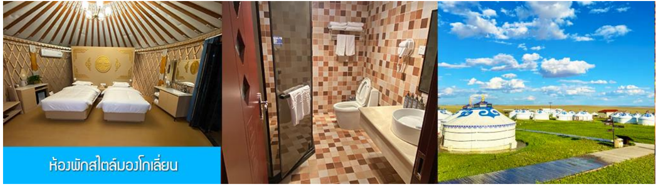
ห้องพักสไตล์มอองโกเลีย

พักที่ ORDOS GLASSLAND MONGOLIAN YURT เป็นห้องพักสไตล์มอองโกเลีย (กระโจม)