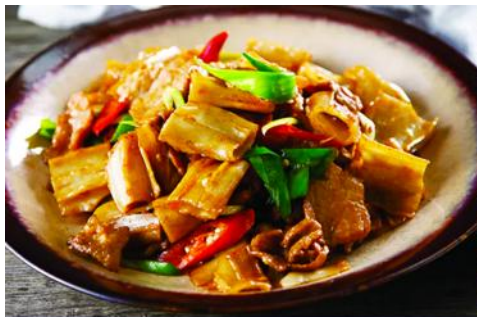
ถนนคนเดินเออร์ดอส

นำท่านเที่ยวชม สวนวัฒนธรรมหมงกู่หยวนหลิว 蒙古源流 เป็นอุทยานท่องเที่ยวเชิงประวัติศาสตร์และวัฒนธรรมระดับ 4A ของจีน ที่เป็นต้นกำเนิดของชนชาติและวัฒนธรรมมองโกล สะท้อนความเป็นจักรวรรดิที่ยิ่งใหญ่เมื่อ 700 ปีก่อน ชม ประตูจงเทียน 崇天门 สุดมโหฬารที่แสดงถึงความยิ่งใหญ่ของจักรวรรดิมองโกล ชม จัตุรัสเถิงเก้อหลี่ 腾格里广场 จัตุรัสกลางแจ้งขนาดใหญ่ที่ใช้ประกอบพิธีกรรมต่าง ๆ