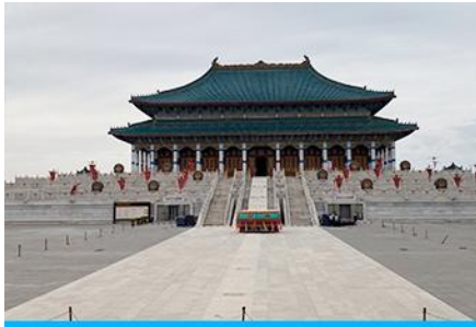
สวนวัฒนธรรม หมงกู่หยวนหลิว

หลังอาหารนำท่าน เที่ยวชม จวนอ๋องจวินหวัง 郡王府 จวนแห่งนี้เริ่มสร้างขึ้นในปี ค.ศ. 1902 สร้างเสร็จในปี ค.ศ. 1936 เป็นที่พำนักของ อ๋องอิฉีจวินหวัง 伊旗郡王 เป็นจวนอ๋องเพียงหนึ่งเดียวได้รับการอนุรักษ์ในสภาพที่สมบูรณ์ โครงสร้างทำด้วยอิฐ หิน และไม้ ประกอบด้วยห้องพัก 16 ห้อง เป็นสถาปัตยกรรมผสมแบบมองโกล ทิเบต และฮั่น