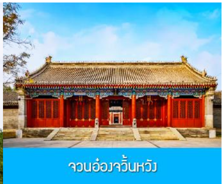
จวนอ๋องจวิ้นหวัง