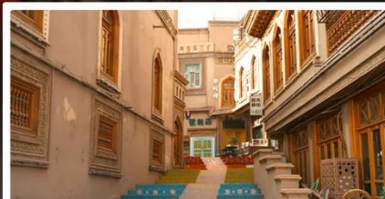
เมืองเก่าคัชการ์