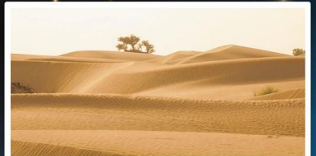
ทะเลทรายทากลามากัน