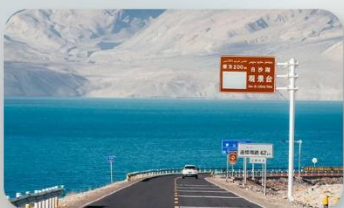
ทะเลสาบไป๋ซาหู