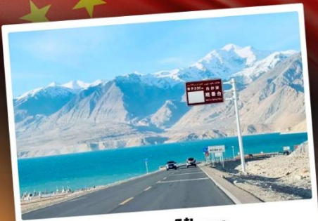
ทะเลสาบไ披ซาหู

“ซินเจียงใต้” ดินแดนแห่งทะเลทราย สัมผัสวัฒนธรรมของชาวซินเจียงอุยกูร์