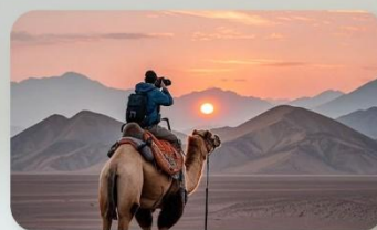
ทะเลทรายทากลามากัน