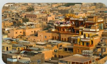
เมืองเก่าคีซการ์