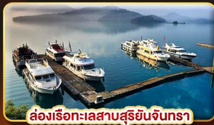
ล่องเรือทะเลสาบสุริยอันจินตรา