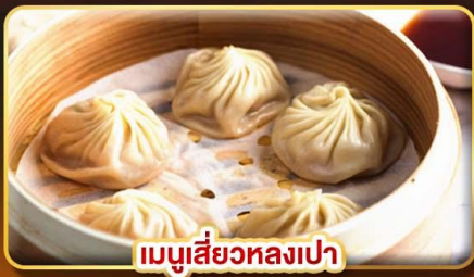
เมนูเสี่ยวหลงเปา