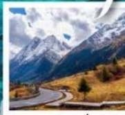
อุทยานภูเขาสืดรุณี