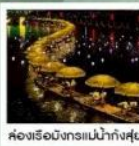
ส่องเรือมังกรแม่น้ำก้งซู่ย