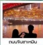
ถนนจินซาเหมิน