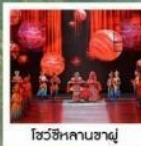
โซ่วซีหลานซาตู้