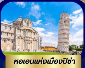
หอเอนแห่งเมืองปิซ่า

Special OFFER ฟรี!! ล่องเรือ Gondola เกาะเวนิส เมืองแห่งสายน้ำสุดโรแมนติก