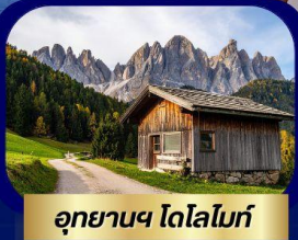
อุทยานฯ โดโลไมท์