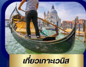
เที่ยวเกาะเวนิส