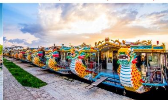
ล่องเรือมังกร