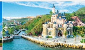
สวนสนุกวินวันเดอร์ส

*ทางบริษัทฯ ขอสงวนสิทธิ์ในการสลับโปรแกรมทัวร์ตามความเหมาะสมขึ้นอยู่กับสถานการณ์หน้างาน โดยคำนึงถึงผลประโยชน์ของลูกค้าเป็นสำคัญ