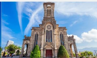
โบสถ์หินญาจาง