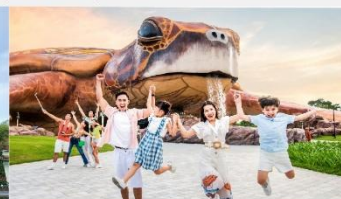
วินเพิร์ล อควาเรียม

*ทางบริษัทฯ ขอสงวนสิทธิ์ในการสลับโปรแกรมทัวร์ตามความเหมาะสมขึ้นอยู่กับสถานการณ์หน้างาน โดยคำนึงถึงผลประโยชน์ของลูกค้าเป็นสำคัญ