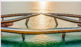
สะพานจูป