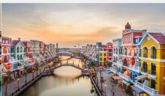
แกรนด์เวิลด์ฟูท๊วก